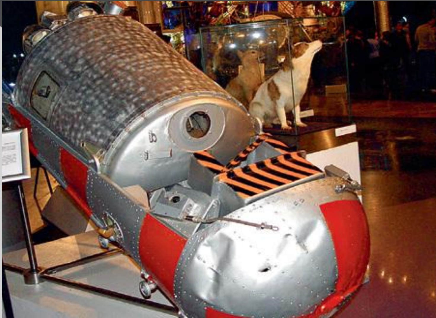
Капсула, в которой приземлились легендарные собаки