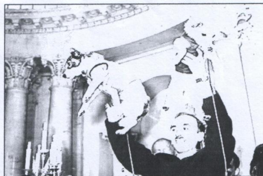
Собаки Белка и Стрелка вернулись из космоса.

Вслед за Лайкой полетели другие собаки- БЕЛКА и СТРЕЛКА