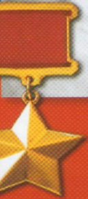
ГАГАРИН Юрий Алексеевич летчик-космонавт СССР