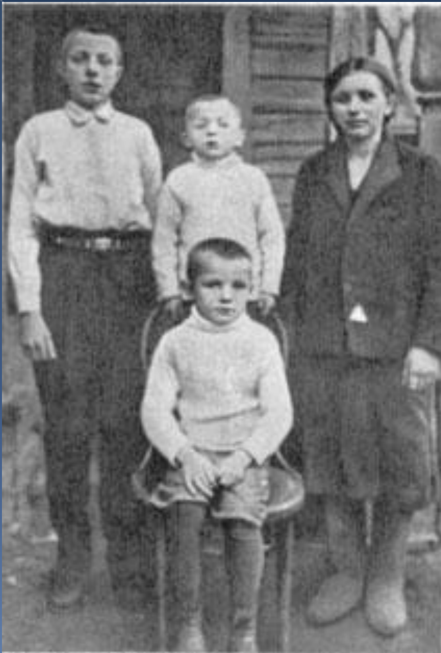
Детские годы. Юрий Гагарин (сидит в центре), его старший брат Валентин, младший брат Борис и сестра Зоя