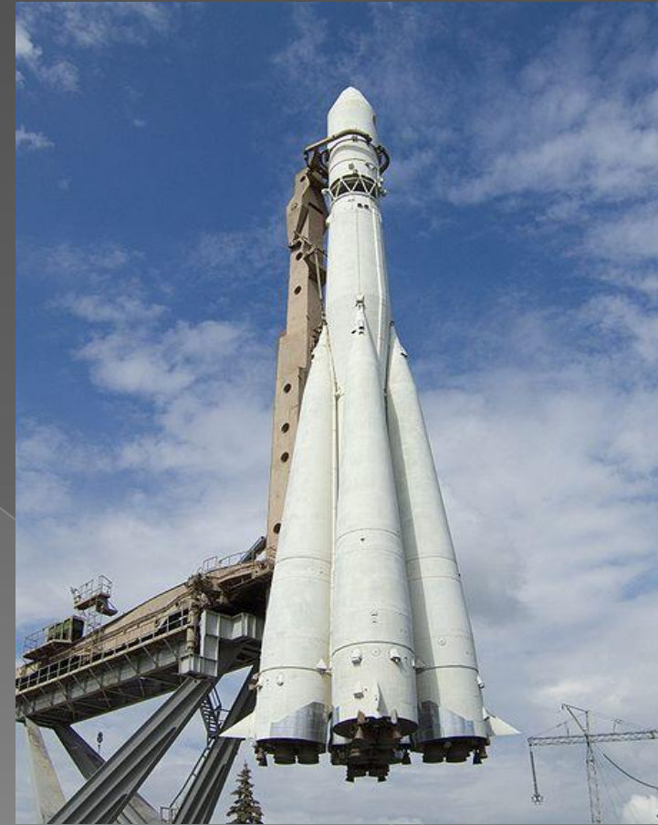
Макет ракеты-носителя “Восток” в Москве

Восток — наименование серии советских космических кораблей, предназначенных для полётов по околоземной орбите. Создавались под руководством генерального конструктора Сергея Павловича Королёва с 1958 по 1963 год.