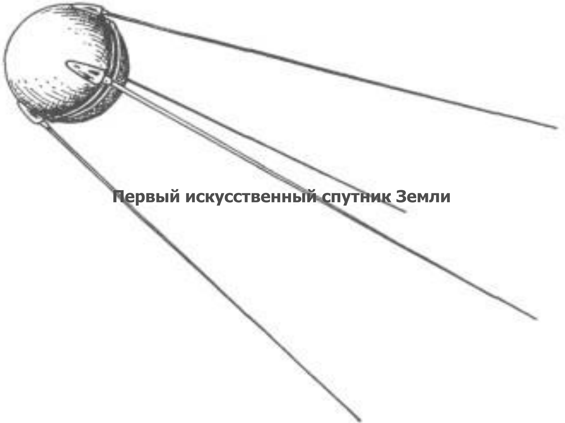
Первый искусственный спутник Земли