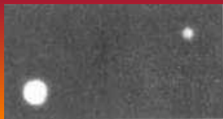
Плутон со спутником

Плутон является наименьшим из больших планет