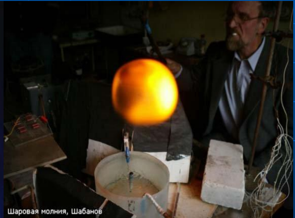
Шаровая молния, Шабанов