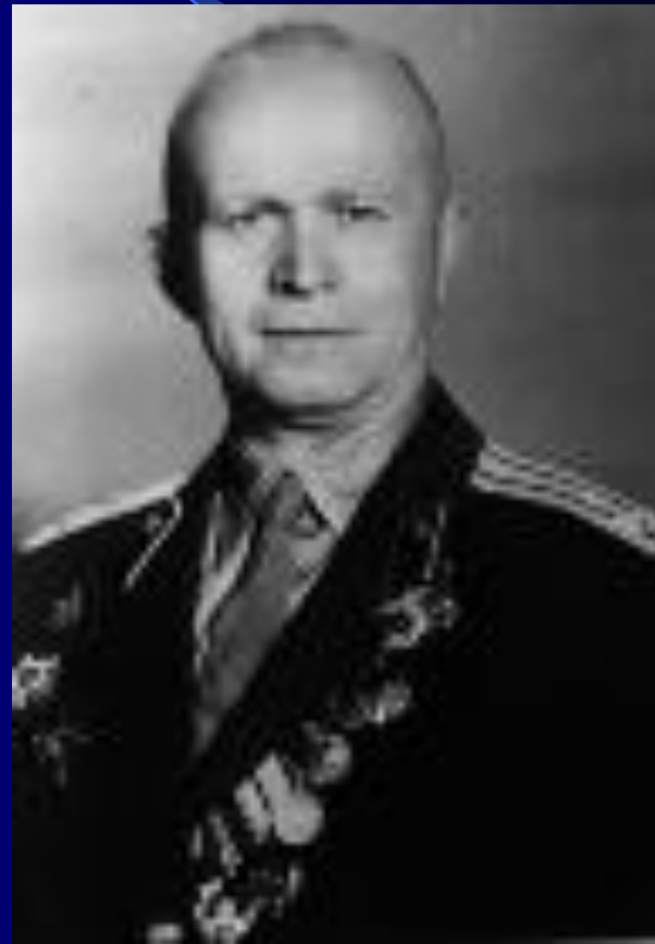
Яздовский Владимир Иванович