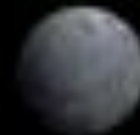
2007 OR 10