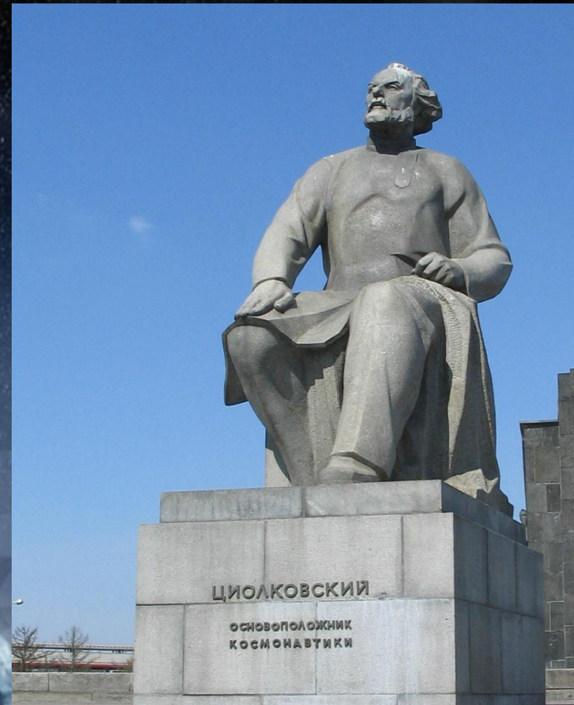
Памятник К.Э.Циолковскому в Москве.