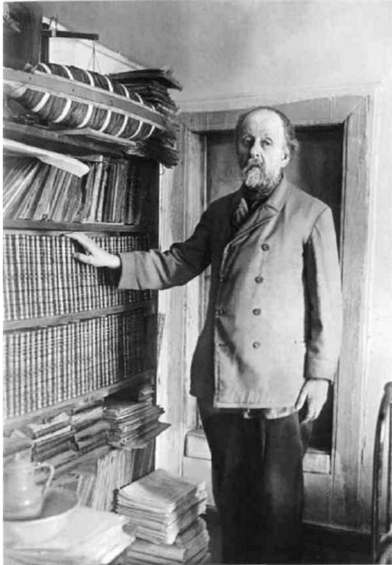
Циолковский в своей библиотеке 1930г.

Константин Эдуардович мечтал о космических ракетах- сегодня в небеса с ревом взмывают космические корабли. Он думал о больших космических домах, вращающихся вокруг Земли- сегодня над нашей планетой летают гигантские орбитальные станции. Именно он составил первое описание скафандра- одежды космонавтов.