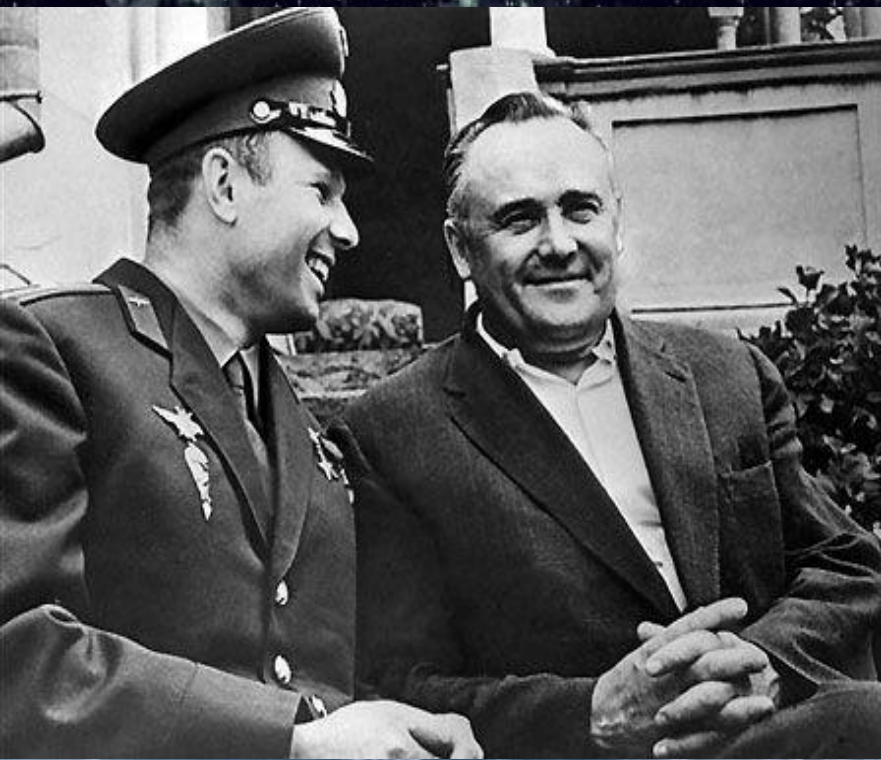
Ю.А.Гагарин и С.П.Королев.

Идея изучения просторов Вселенной с помощью автоматической техники имеет свои преимущества и свои недостатки. Отсутствует прямая опасность для человека - в случае неудачи гибнет техника, а не люди. Расширяется диапазон полетов: аппаратам доступны любые уголки космоса. Однако нет возможности устранить сложные неполадки, мгновенно среагировать на неожиданности.