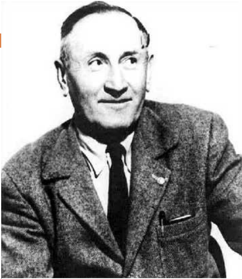
Фриц Цвикки (1898 – 1974) — американский астроном.