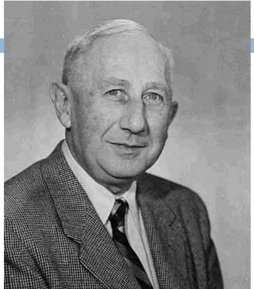
Вальтер Бааде (1893 - 1960) — немецкий астроном и астрофизик.