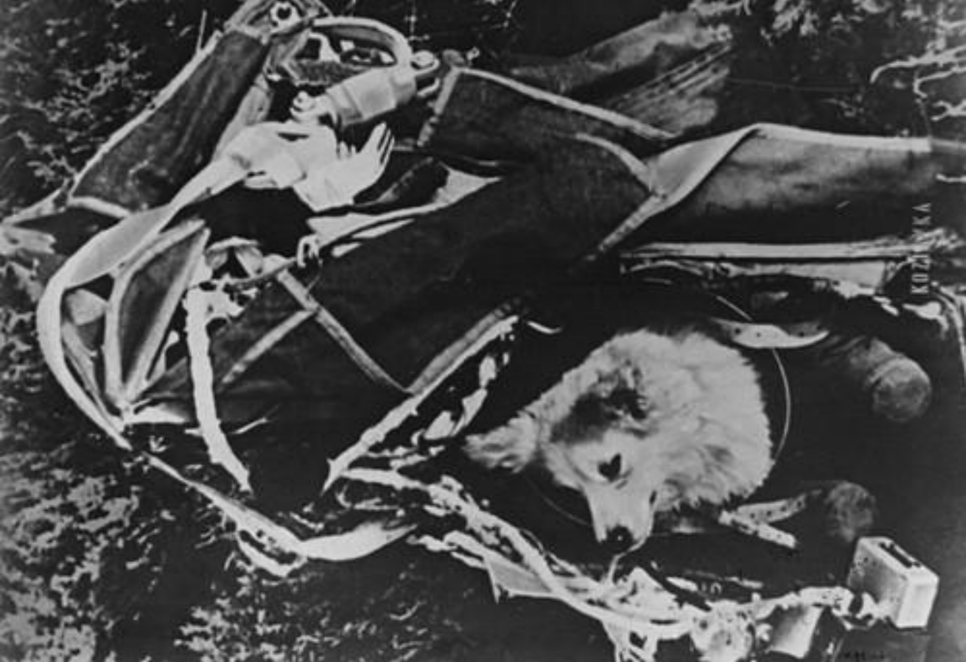
После приземления. Собака Козявка.