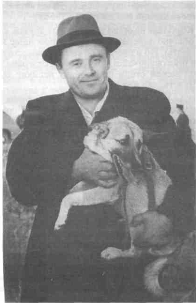
С.П. Королёв с собакой, возвращённой на Землю после вертикального полёта на ракете Р-1. Капустин Яр, 1951 г.

Космическими полетами собак занималась вся команда ученых и инженеров во главе с академиком Сергеем Королевым.