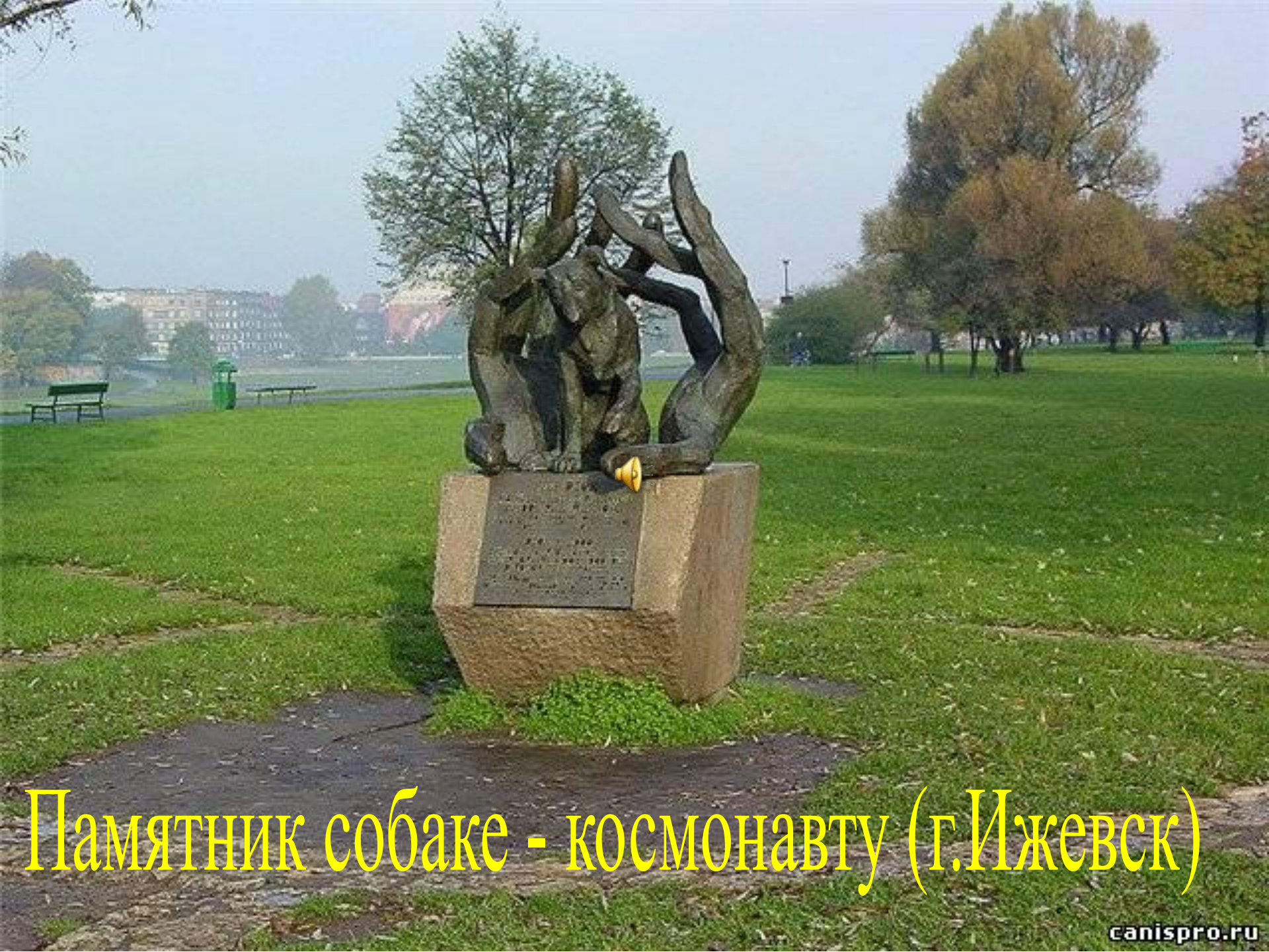
Памятник собаке - космонавту (г.Ижевск)