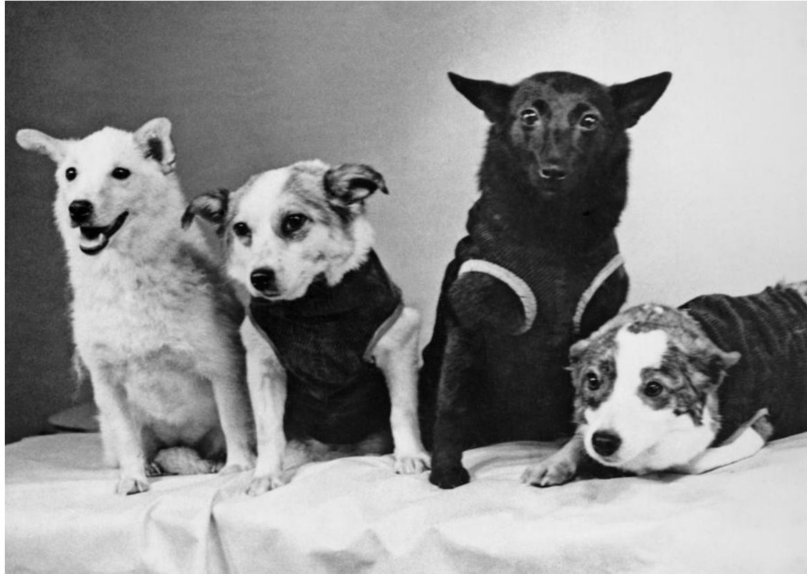
Белка, Звёздочка, Чернушка, Стрелка.

Собаки составляют, пожалуй, наибольший отряд животных побывавших на орбите. В процессе подготовки полета человека в космос на орбите побывали такие собаки: Лайка, Дезик, Цыган, Кусачка, Козявка, Модница, Чижик, Непутёвый, Смелый, Дамка, Белянка, Малышка, Мишка, Снежинка, ЗИБ, Рыжик, Лиса, Бульба, Рита, Кнопка, Альбина, Минда, Джойна, Рыжая, Пальма, Пёстрая, Отважная, Малёк, Жемчужная, Пушок, Жульба, Белка, Стрелка, Кнопка, Уголек, Звёздочка и Ветерок.