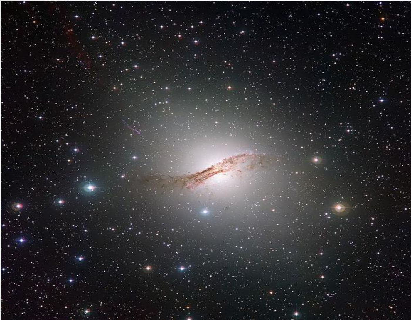
Радиогалактика Центавр А в видимом свете