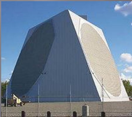
Современный радар на основе фазированных антенных решёток