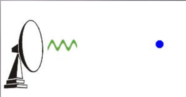
Принцип действия импульсного радара