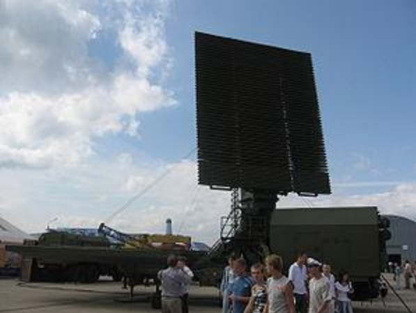
Мобильная РЛС «Противник-ГЕ»