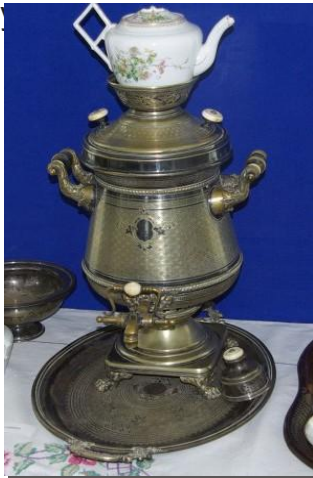
в даже в Варшаве.

маска-забрало, кольчуга, щит. Из огнестрельного оружия - 4-х и 5-ти ствольные пистолеты, Музейные фонды