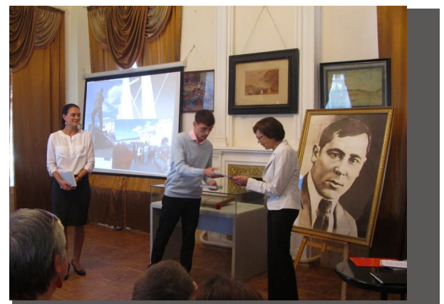
Моабитские тетради М.Джалиля. 21.08.2015 г.

РТ, г. Чистополь, ул. К. Маркса, 31 Тел./факс: 8(84342) 5-31-10; 5-11-00 http://chisto-muzei.ru e-mail: gorodnakan@2012@mail.ru e-mail: gorodnakan@2012@mail.ru