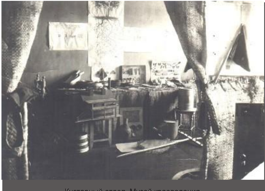
Кустарный отдел. Музей краеведения. Чистопольский кантполитпросвет. 13.02.1923 г.