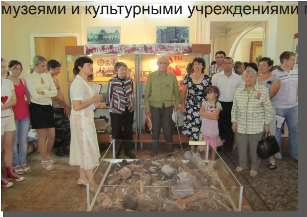
Воина прошла свой след в земле оставив. 06.07.2012 г.

Сотрудниками музея проводится большая исследовательская деятельность, работа с населением по изысканию новых экспонатов в фонды музея-заповедника. Открываются новые тематические выставки и экспозиции, проводятся музейные уроки для детей дошкольного и школьного возраста, интерактивные программы, литературно-музыкальные вечера, мастер-классы, совместные мероприятия с музеями и культурными учреждениями г. Казани.