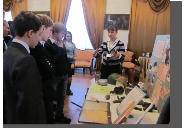
Моя война, моя Победа. 10.05.2013 г.