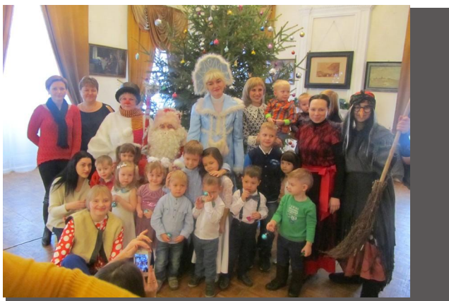
Чудеса под Новый год. 29.12.2014 г.