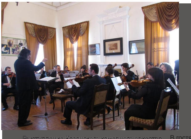
Выступления Казанского камерного оркестра LA PRIMAVERA. 07.02.2014 г.