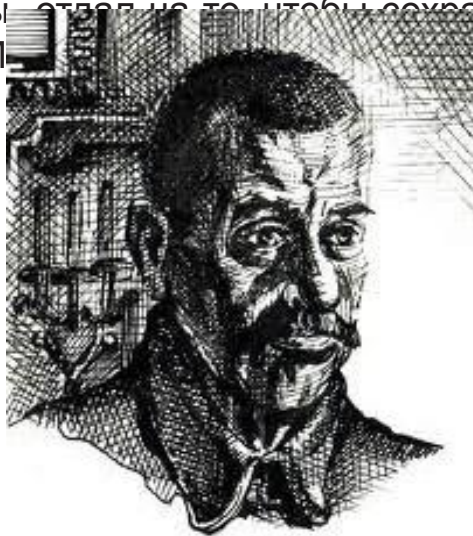
Графическое изображение портрета А.К. Булича (Авдеев В.Д., холст, масло) работы Аделя Лутфуллина.

Александр Булич родился в семье помещика Константина Никитича Булича. В 1892 году он закончил естественнонаучное отделение Казанского Императорского университета. В университете выходят его первые научные труды, посвященные изучению родной природы: «Ботанические наблюдения во время экскурсии по Волге в 1891 году» (1892),