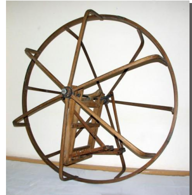
Интерес представляет велосипед, изготовленный в 1902 году. Внутри колес, видны педали и седло.