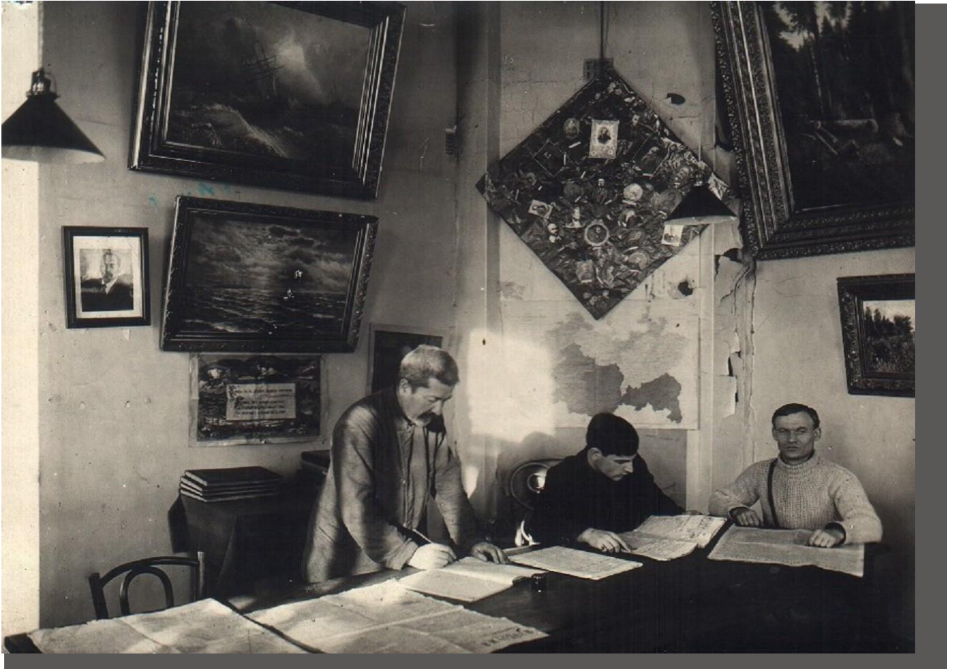
Музей краеведения. Читальня Центральной библиотеки Библиотечно-кабинетно-читальня из ЦОСвета.