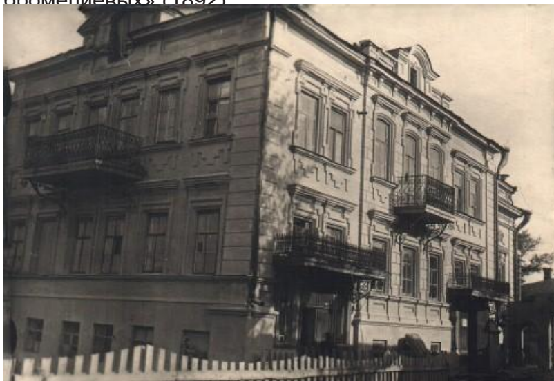
Купеческий особняк А.А. Подуруева, вторая половина XIX в.

обстоятельствам он оставляет научную работу в столице и в марте 1895 года возвращается в Чистополь. Его назначают исполняющим обязанности земского начальника 6-го участка Чистопольского уезда, где он работает до 1908 года. Булич собирает материалы по ботанике, истории родного края, археологии. В силу обостряющихся отношений с представителями власти он уезжает в Тулу, а затем в Саратов, где и изучает физиологию человеческого переворота.