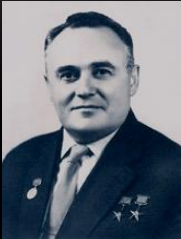
Сергей Павлович Королев

Этот полет стал результатом огромной работы, которую под руководством Сергея Королева проводили советские ученые. Запуск нужно было проводить как можно быстрее, так как к подобному эксперименту готовились американцы.