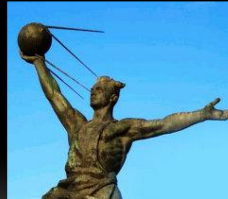
Памятник конструкторам первого искусственного спутника Земли