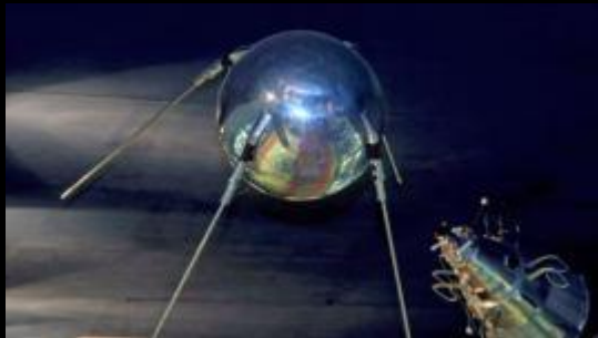
Памятник конструкторам первого искусственного спутника Земли