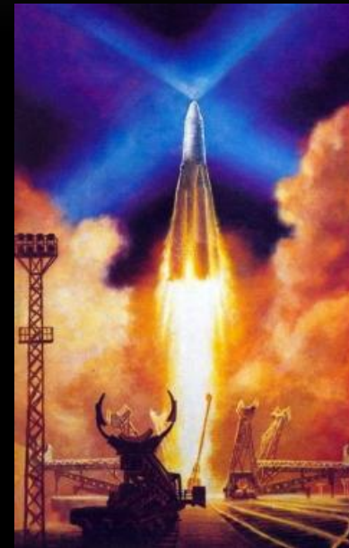
А.Соколов. Старт первого искусственного спутника Земли