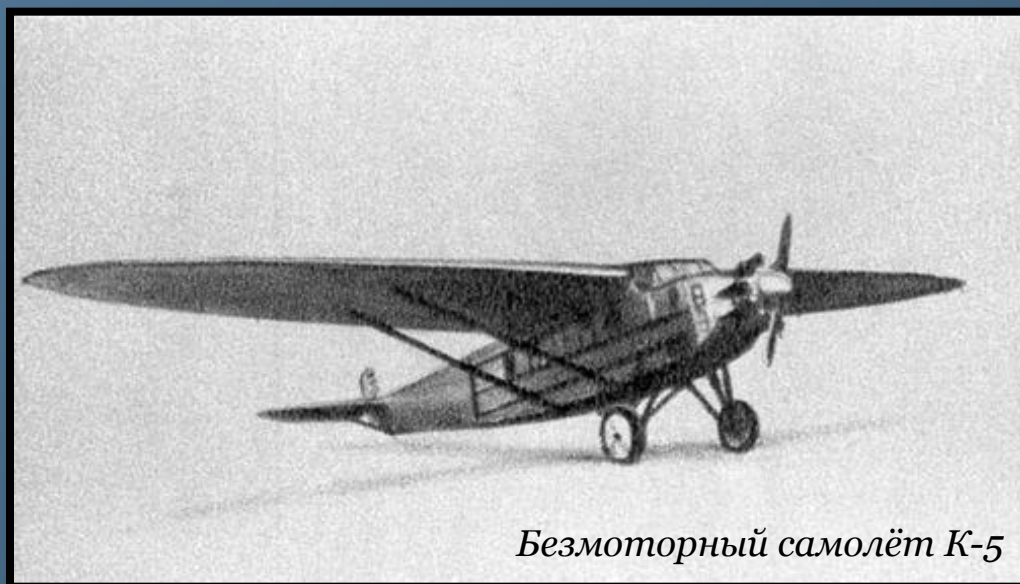
Безмоторный самолёт К-5

Поступив в 1924 году в Киевский политехнический институт по профилю авиационной техники, Королёв за два года освоил в нём общие инженерные дисциплины и стал спортсменом-планеристом. Осенью 1926 года он переводится в Московское высшее техническое училище (МВТУ) имени Н. Э. Баумана.