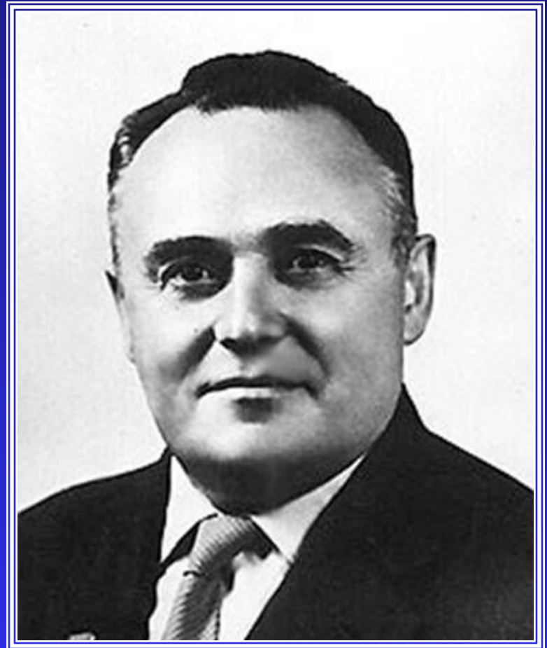
Сергей Павлович Королев