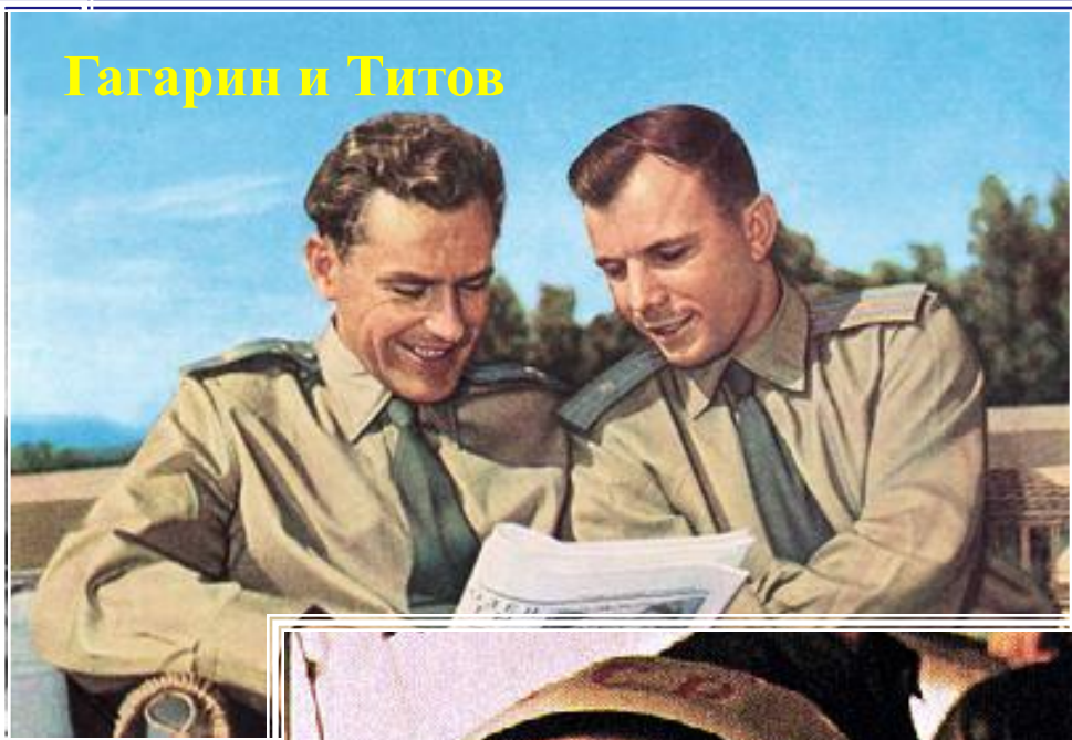
Гагарин и Титов

Кроме Гагарина, были ещё претенденты на первый полёт в космос, всего было двадцать человек. Они обладали отменным здоровьем. Но того, кто полетит в космос, определили в последний момент, на заседании ГК, ими стали Гагарин и его дублёр Герман Титов