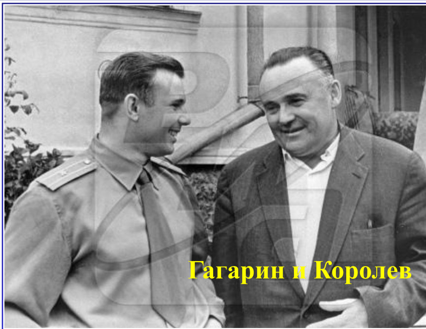
Гагарин и Королёв