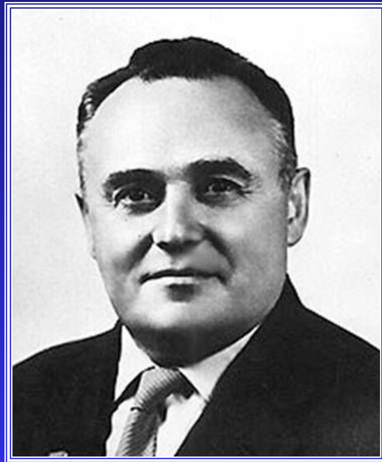
Сергей Павлович Королев