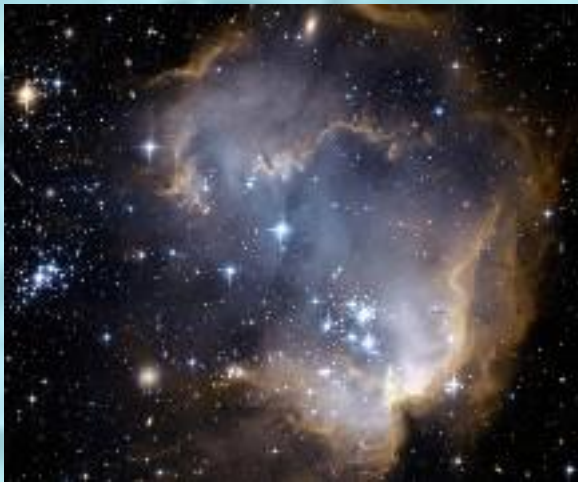
На окраинах ММО, молодое звездное скопление NGC 602. Фото телескопа Хаббл

через блеск (яркость) звезд и звездные величины.