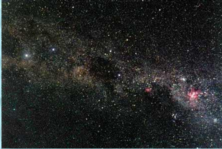
Млечный путь в районе Южного Креста.

В 1610г Г. Галилей , разглядев в Млечном Пути множество звезд, говорит, что они находятся на разном расстоянии от Земли.