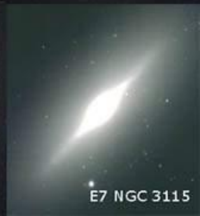
E7 NGC 3115