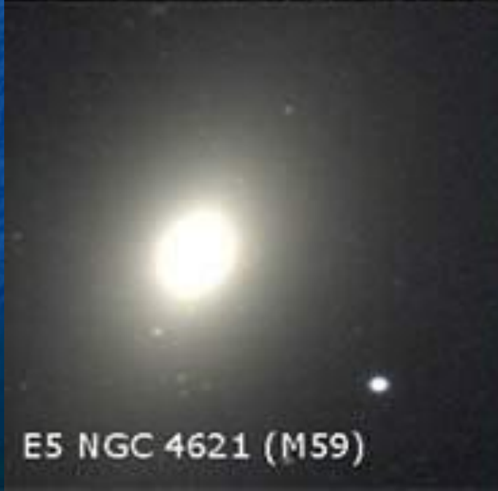
E5 NGC 4621 (M59)