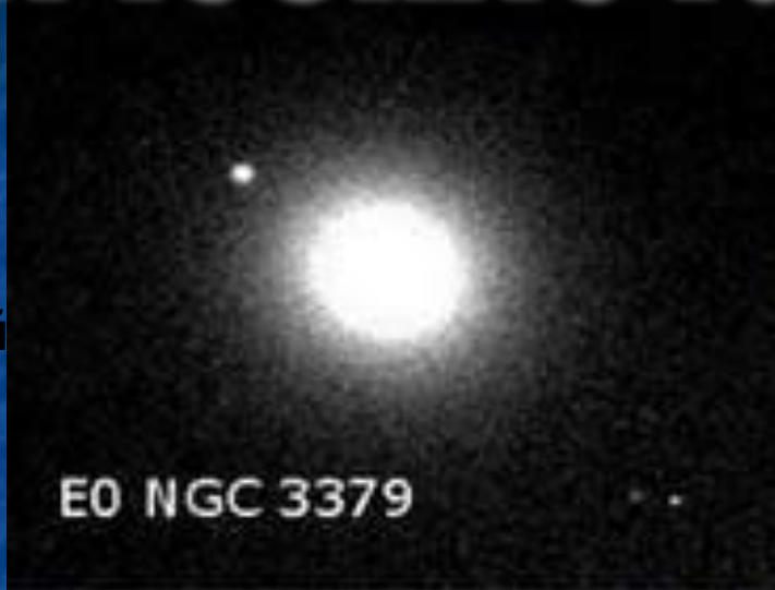
E0 NGC 3379

Эллиптические галактики обозначаются буквой E, имеют разную степень сжатия: от круглых (E0) до сильно сжатых (E7). Заметное вращение наблюдается только у галактик со значительным сжатием.