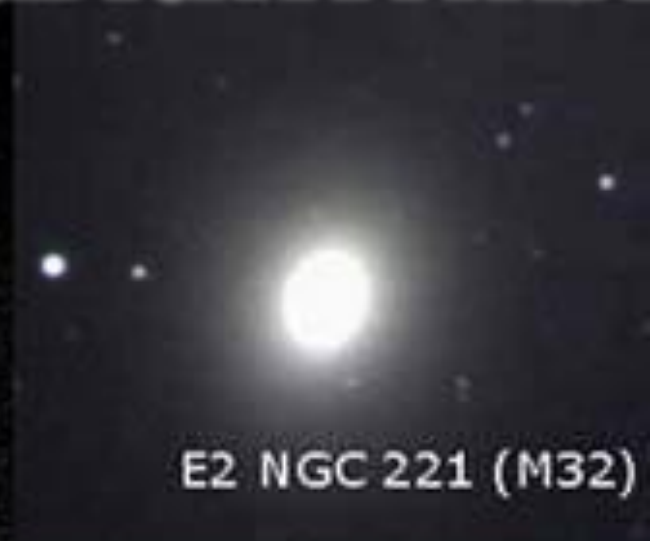
E2 NGC 221 (M32)