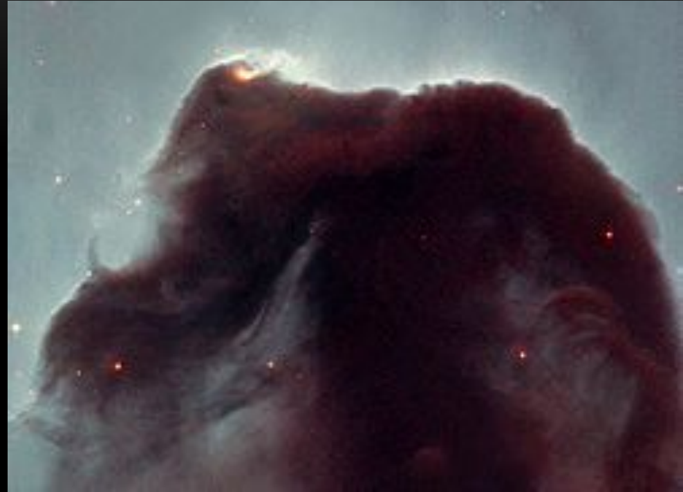
Туманність Кінська Голова