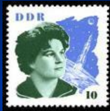
Почтовая марка ГДР, 1963 г.