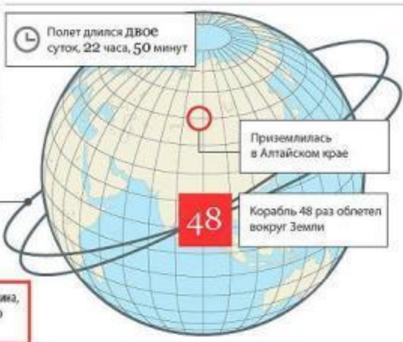
В. Терешкова единственная женщина, имеющая звание генерал – майор звания РФ

При полете Терешкова вела бортовой журнал и делала фотографии горизонта, которые позже были использованы для обнаружения аэрозольных слоёв в атмосфере.