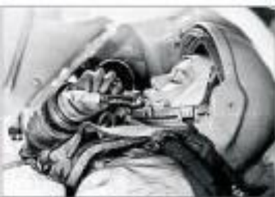
На корабле В. Терешкова была одна