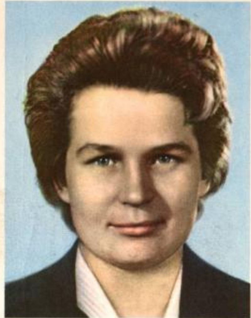
Первая в мире женщина-космонавт, гражданка Союза Советских Социалистических Республик Валентина Владимировна ТЕРЕШКОВА