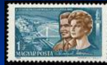
Почтовая марка Венгрии, 1965 г.