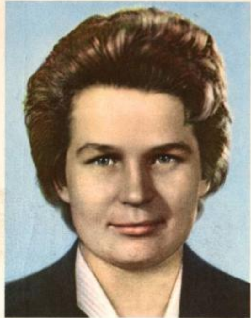
Первая в мире женщина-космонавт, гражданка Союза Советских Социалистических Республик Валентина Владимировна ТЕРЕШКОВА