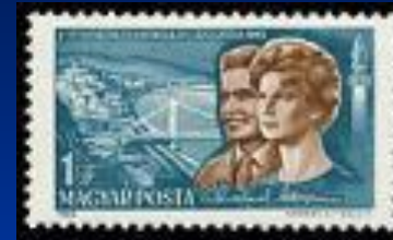
Почтовая марка Венгрии, 1965 г.