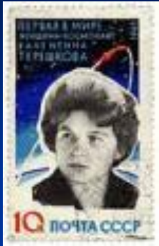
Почтовая марка СССР, 1963 г.