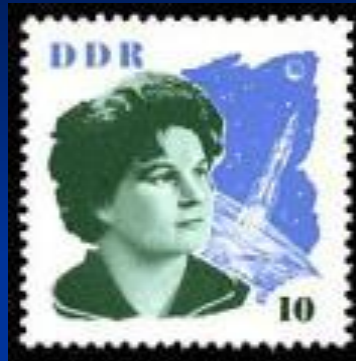
Почтовая марка ГДР, 1963 г.