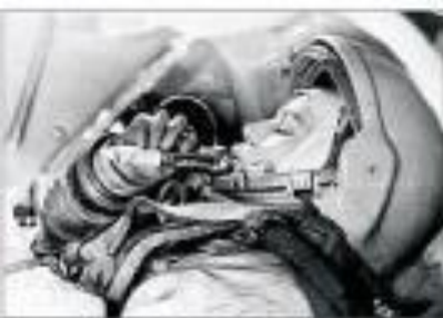
На корабле В. Терешкова была одна