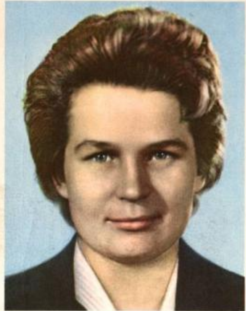
Первая в мире женщина-космонавт, гражданка Союза Советских Социалистических Республик Валентина Владимировна ТЕРЕШКОВА