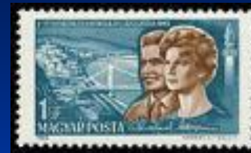
Почтовая марка Венгрии, 1965 г.