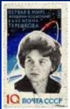
Почтовая марка СССР, 1963 г.