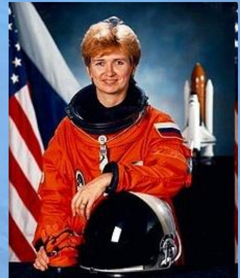
Елена Владимировна Кондакова