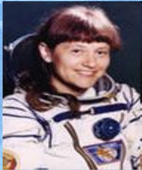
Светлана Евгеньевна Савицкая