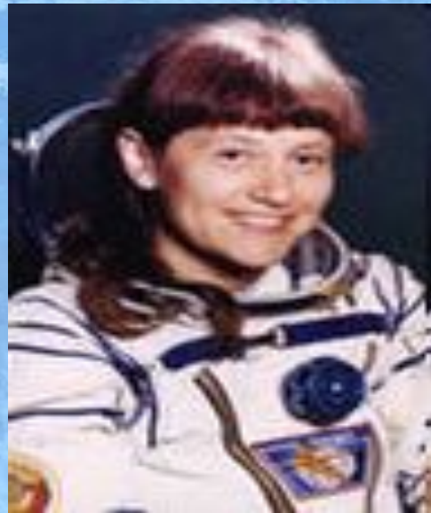
Светлана Евгеньевна Савицкая