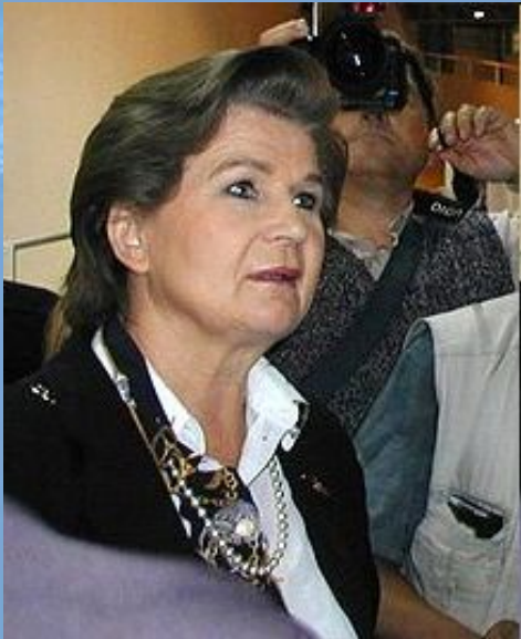
Валентина Владимировна Терешкова