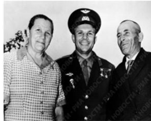
Ю. Гагарин и его родители.