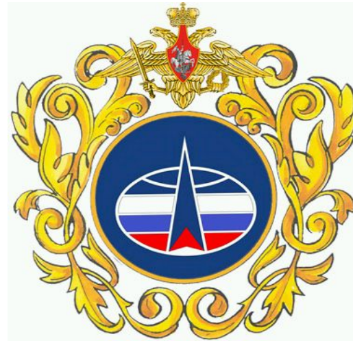
Эмблема ВКС РФ