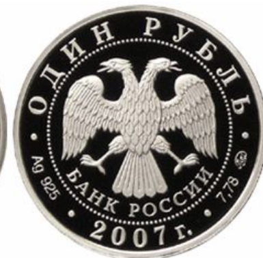
Монета 1 рубль 2007 год "Вооруженные Силы"