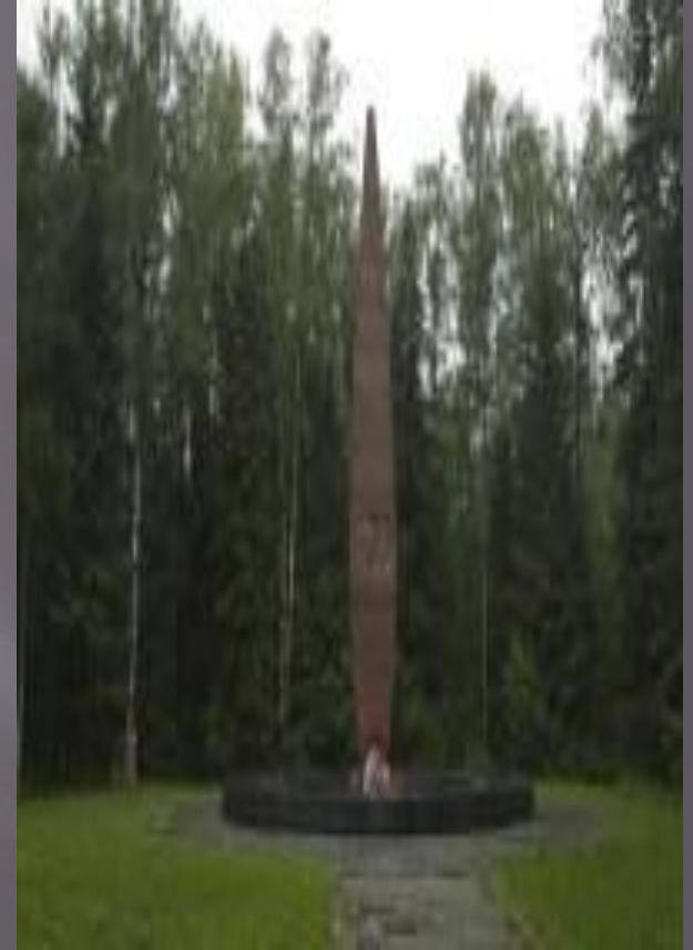
мемориал на месте гибели Гагарина и Серегина

«Нет у меня сильнее влечения, чем желание летать. Летчик должен летать. Всегда летать.»