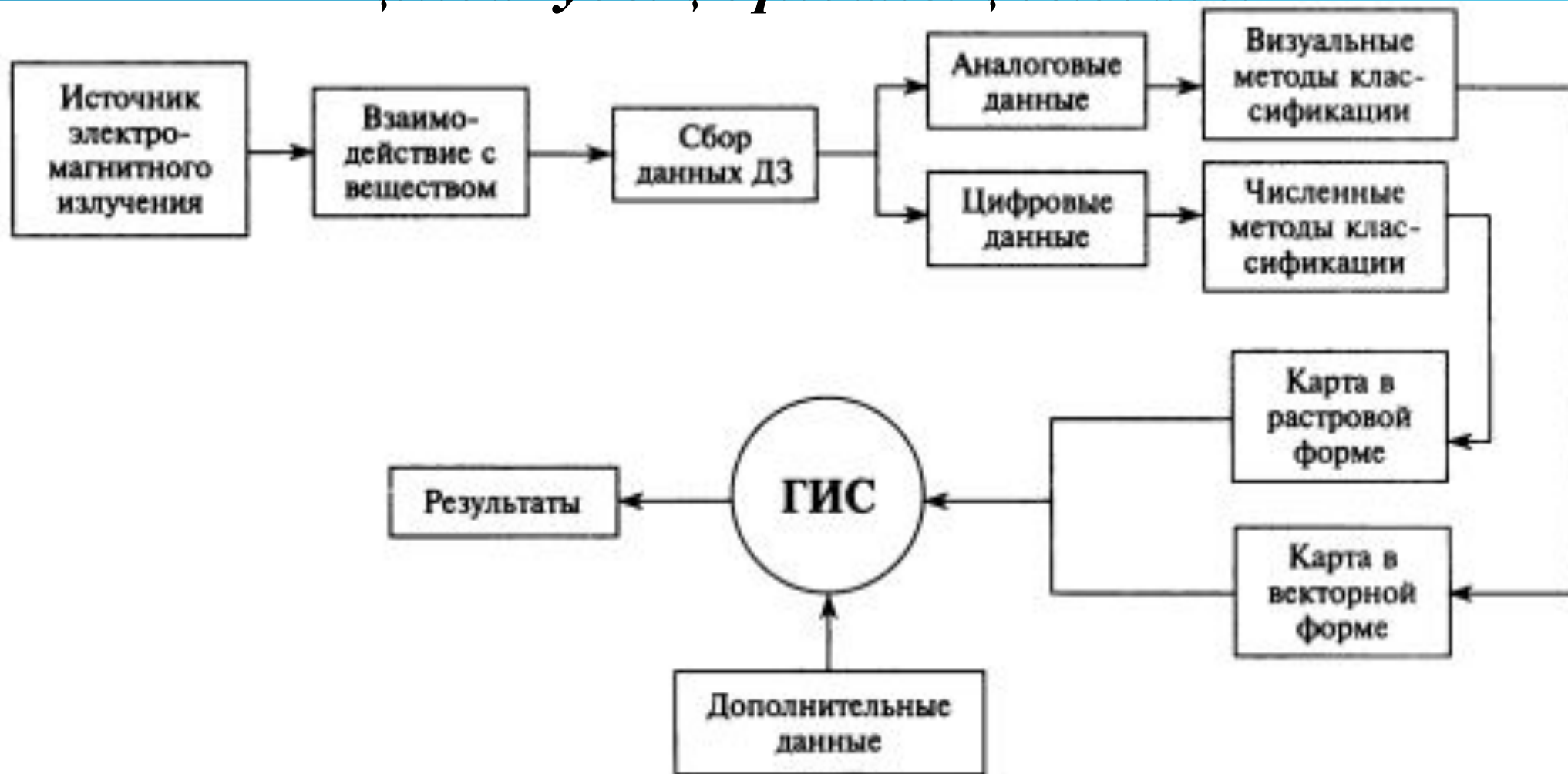
Рис. 1.1. Интеграция данных дистанционного зондирования в ГИС