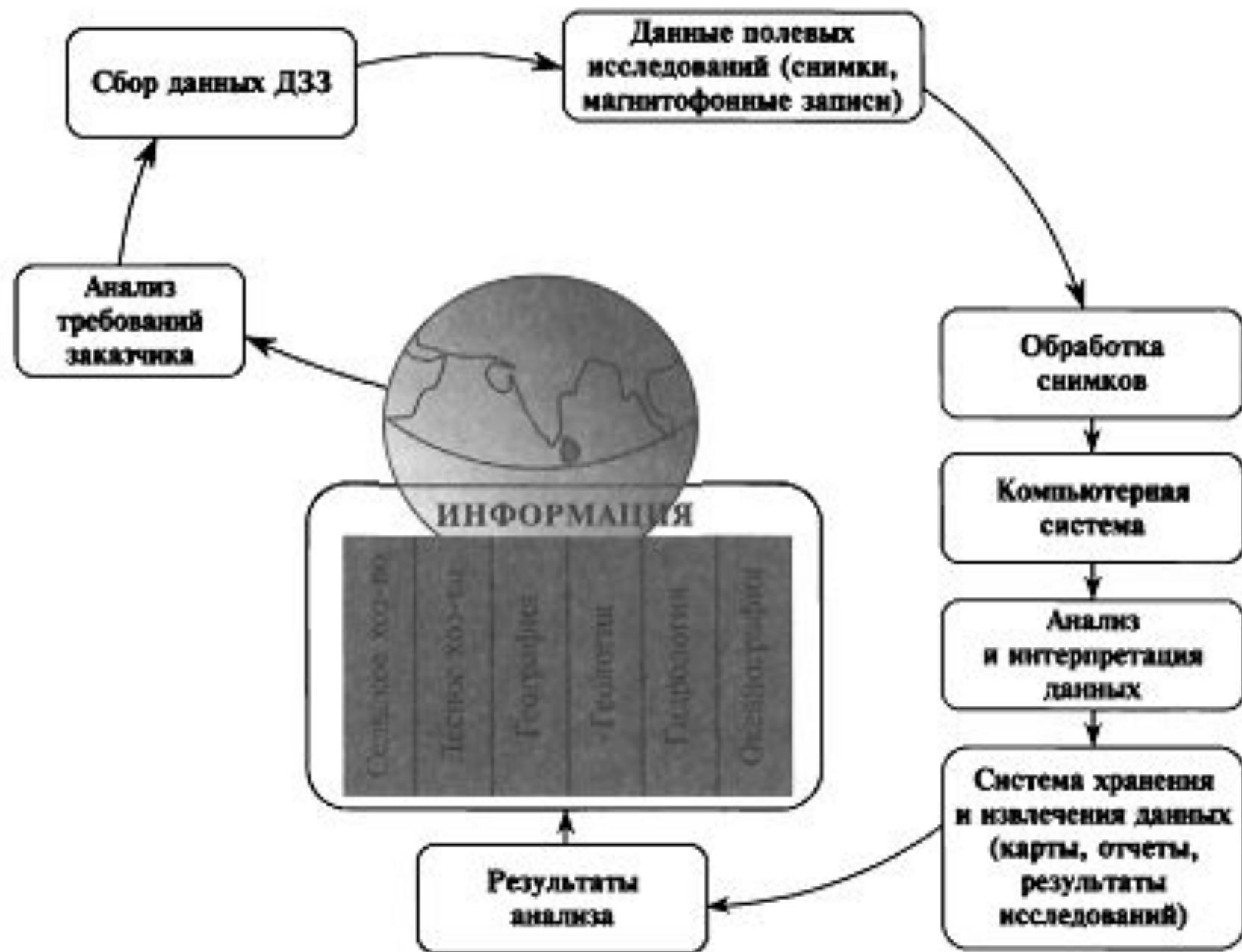
Рис. 1.4. Процесс получения и анализа данных дистанционного зондирования