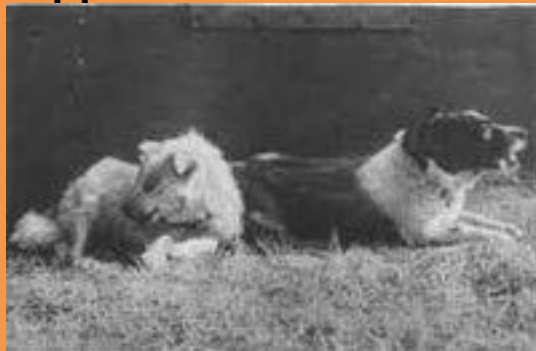
Рыжая и Джойна