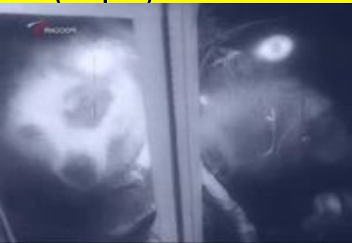
Лиса (вторая) и Рыжик (второй)