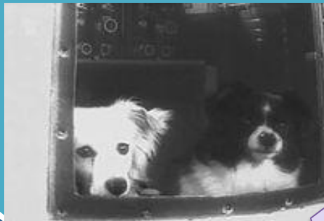
Дезик и Цыган