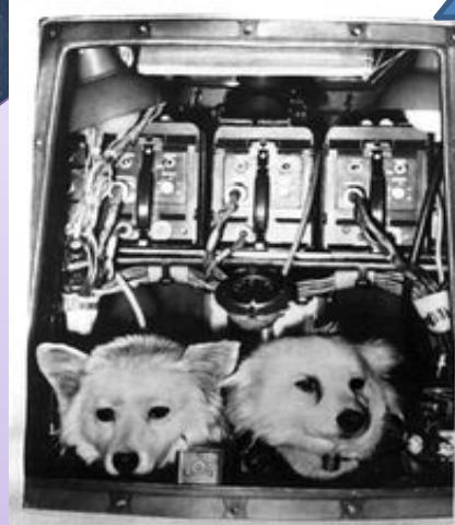
Дезик и Лиса