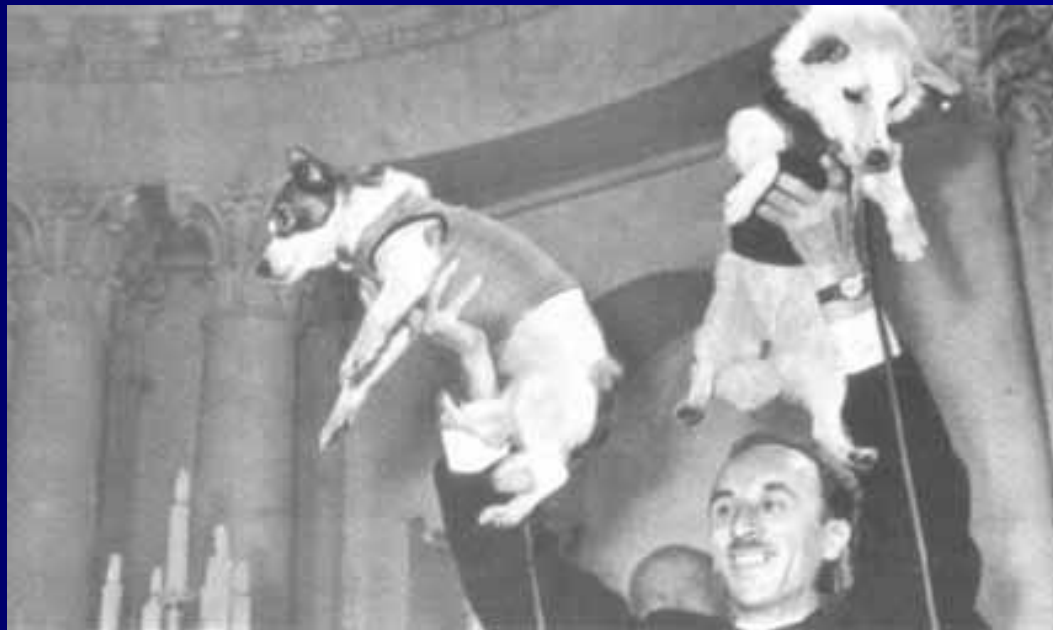
Белка и Стрелка после полёта .

Белка и Стрелка стали всеобщими любимцами. Их возили по детским садам, школам, детским домам. Журналистам на пресс-конференциях давали возможность собачек потрогать, но предупреждали: как бы ненароком не цапнули.