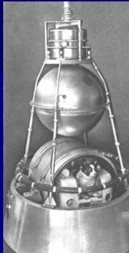
Второй искусственный спутник земли с собакой на борту.