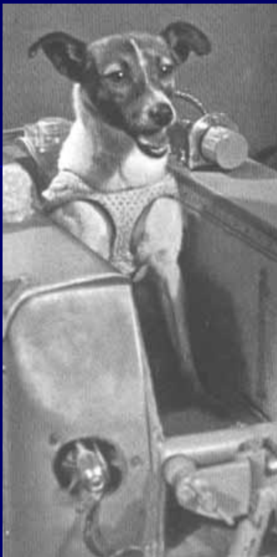
Таким был жилой отсек космической собаки.