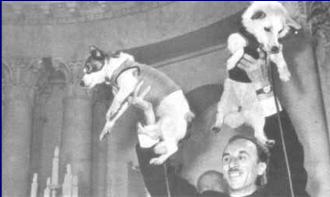
Белка и Стрелка после полёта .

Белка и Стрелка стали всеобщими любимцами. Их возили по детским садам, школам, детским домам. Журналистам на пресс-конференциях давали возможность собачек потрогать, но предупреждали: как бы ненароком не цапнули.