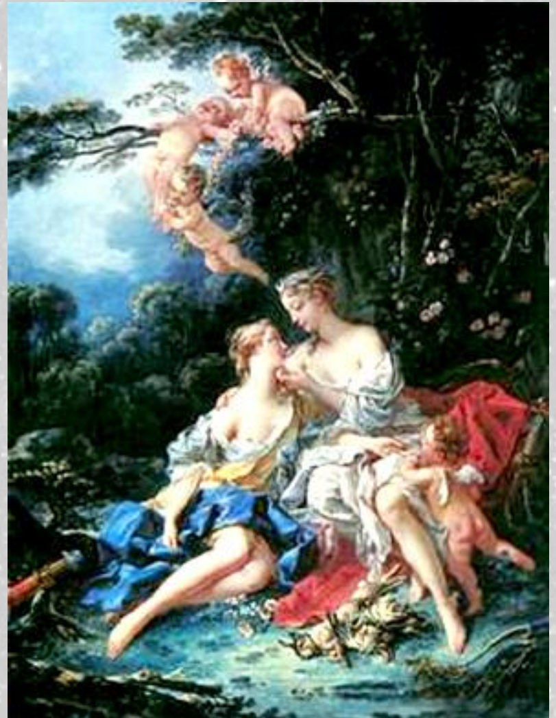
«Юпитер и Каллисто» Франсуа Буше

Каллисто была вовсе не медведицей, а красавицей по имени Каллисто . Ее полюбил могущественный бог Зевс. Разгневанная жена Зевса - злая богиня Гера - решила убить Каллисто. Тогда Зевс превратил Каллисто в медведицу, чтобы спрятать ее от Геры. Некоторое время несчастная Каллисто жила на Земле в виде медведицы. Но это тоже было для нее опасно. Однажды, возвращаясь с охоты, сын Каллисто чуть-чуть не убил собственную мать, так как он подумал, что перед ним обыкновенная медведица.