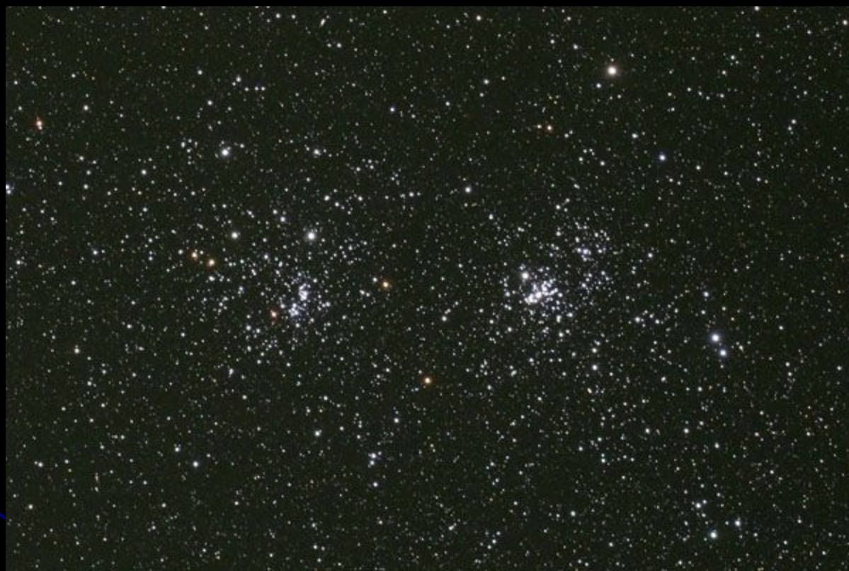
NGC 869 и NGC 884