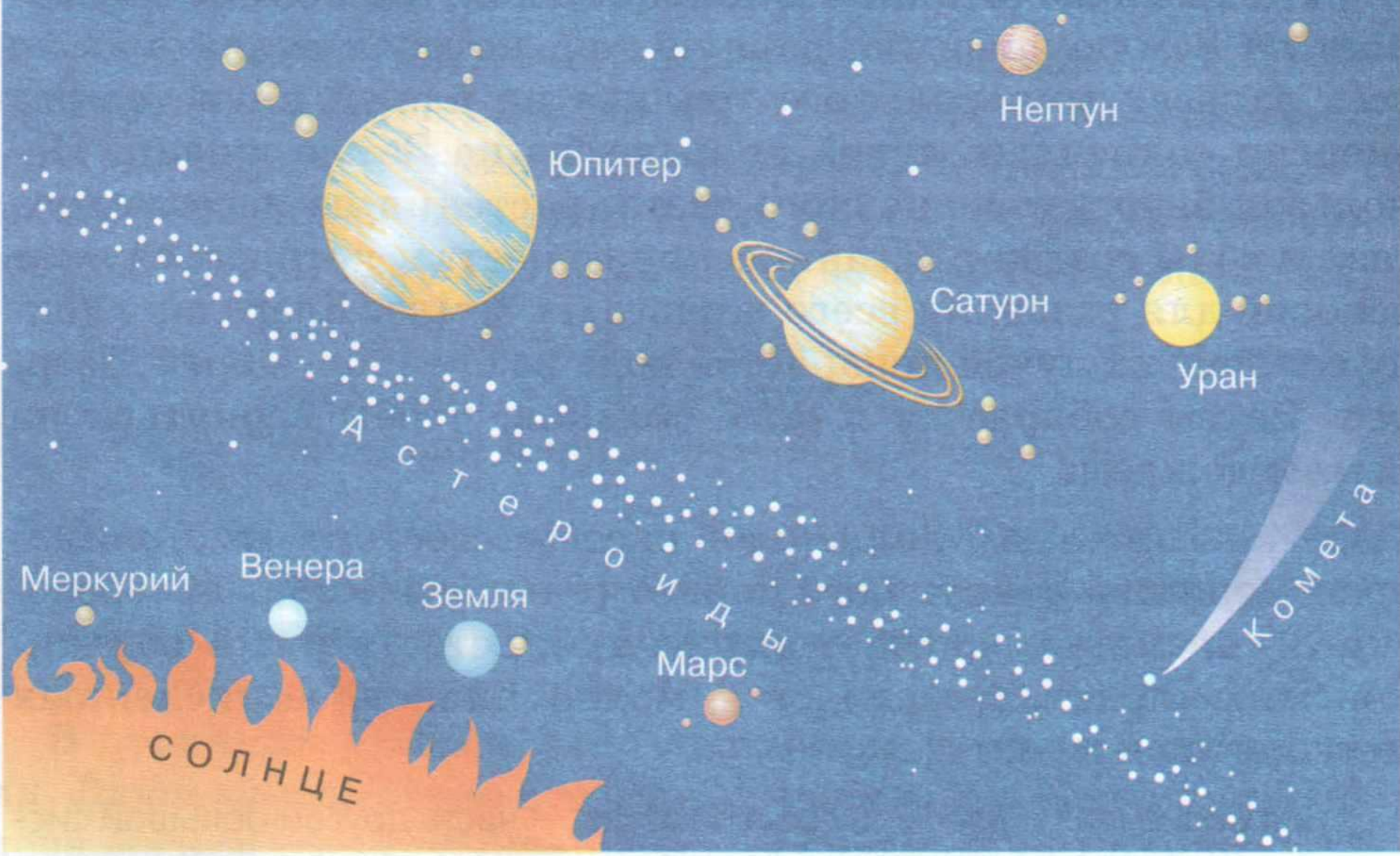
Рис. 18. Солнечная система. Восемь крупных шарообразных планет, вращающихся вокруг Солнца