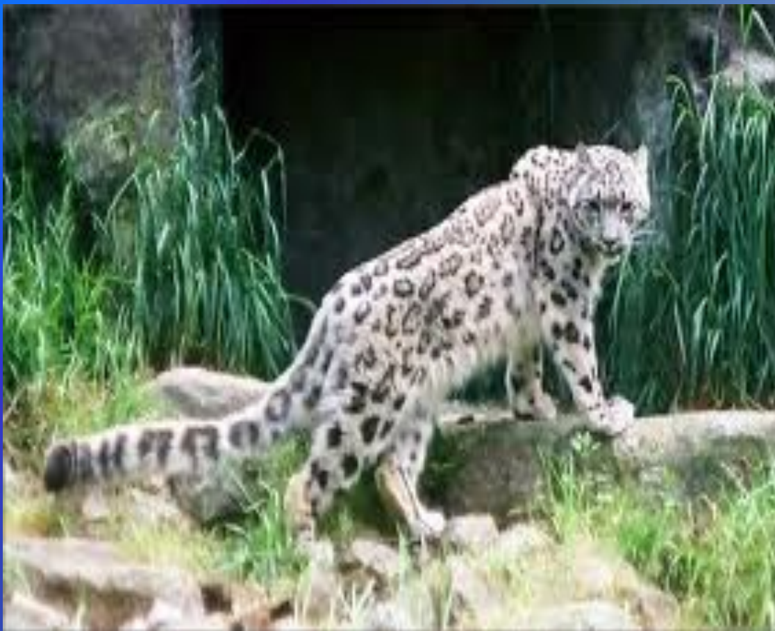
Снежный барс (ирбис)