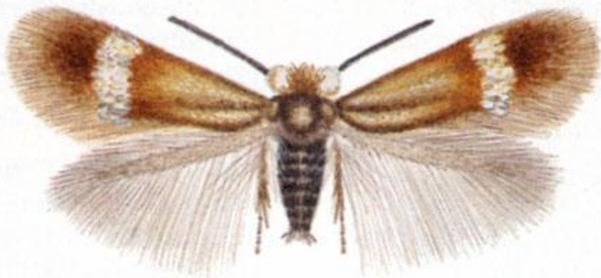
Enteucha acetosae (Stainton, 1854)

Самыми маленькими бабочками считаются ацетозея, обитающая в Великобритании и редикулеза с Канарских островов. Размах их крыльев составляет всего 2 мм!