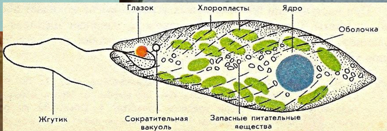
4. Строение зеленой эвглени.