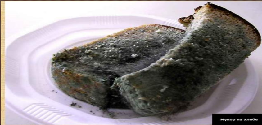
Мухор на хлебе