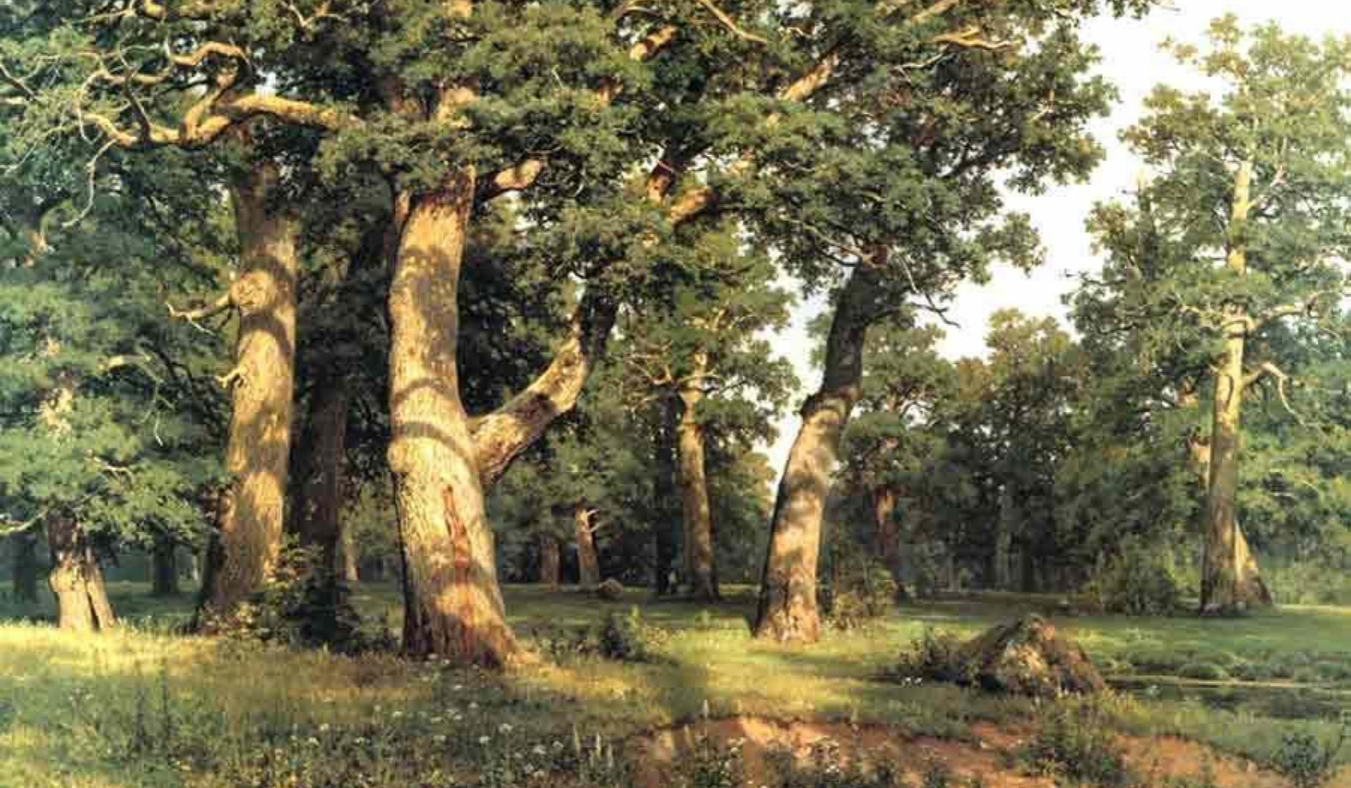
И. И. Шишкин "Дубовая роща"