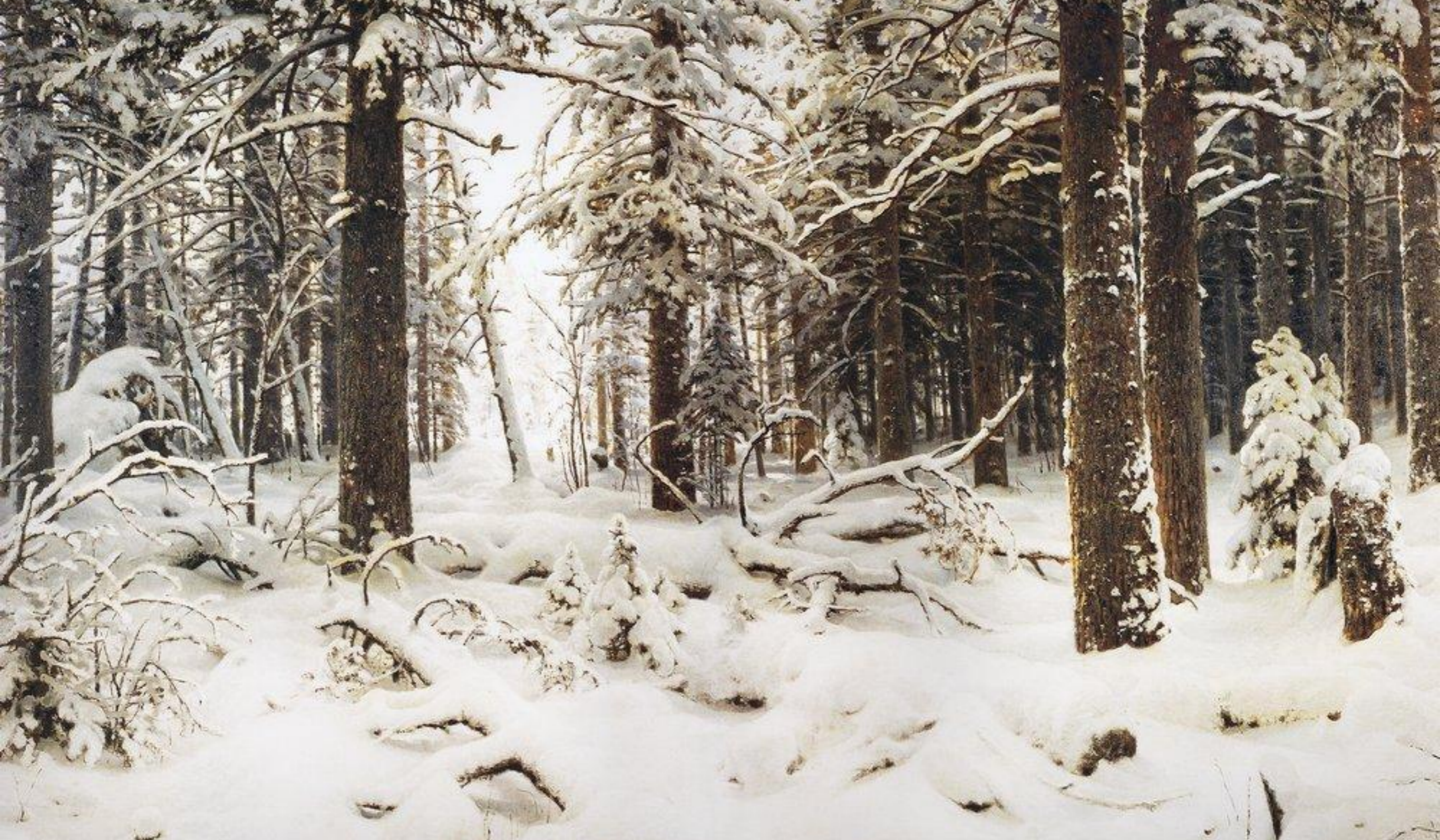
И. И. Шишкин "Зима"