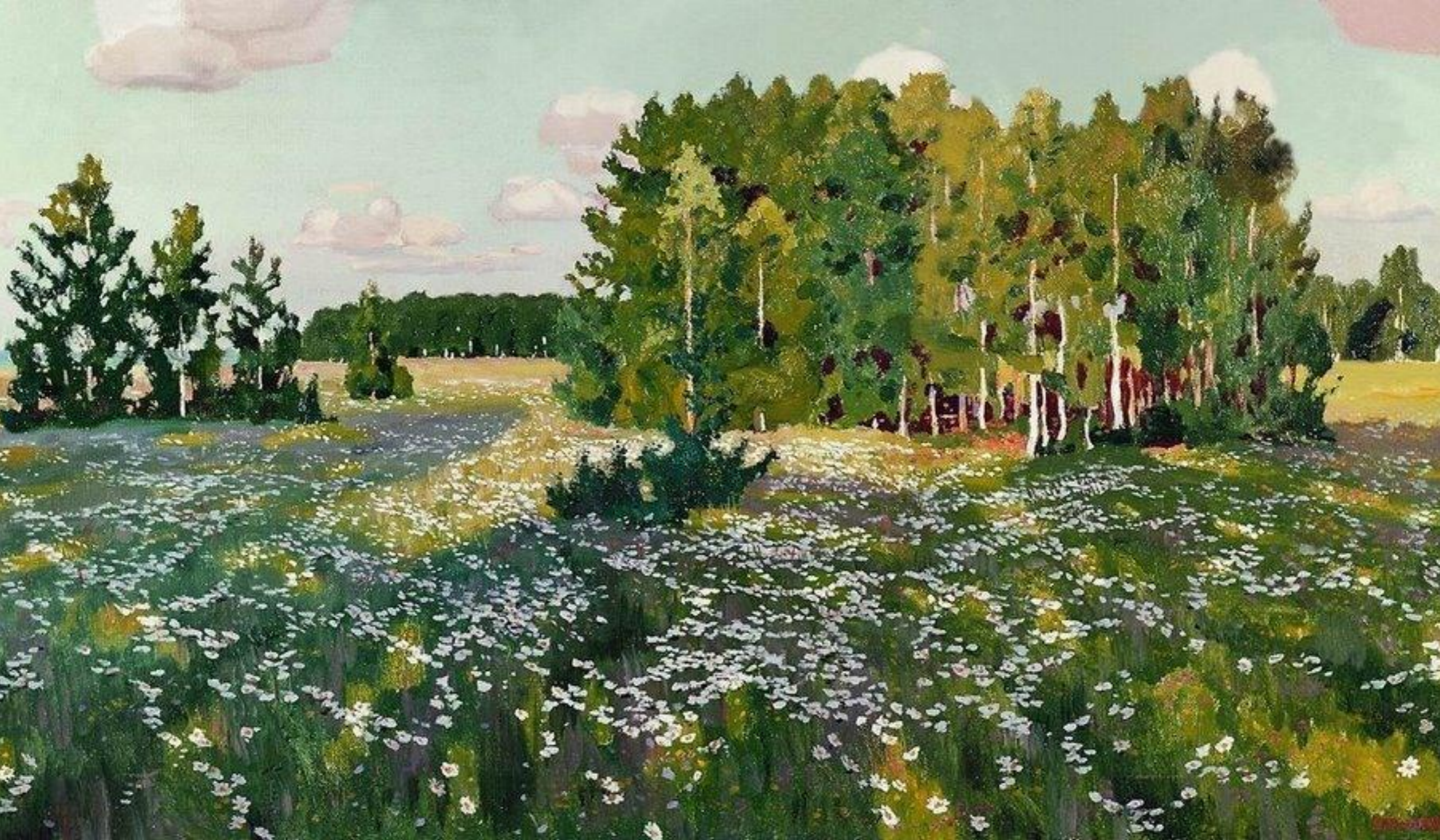
А. А. Рылов "Цветистый луг"