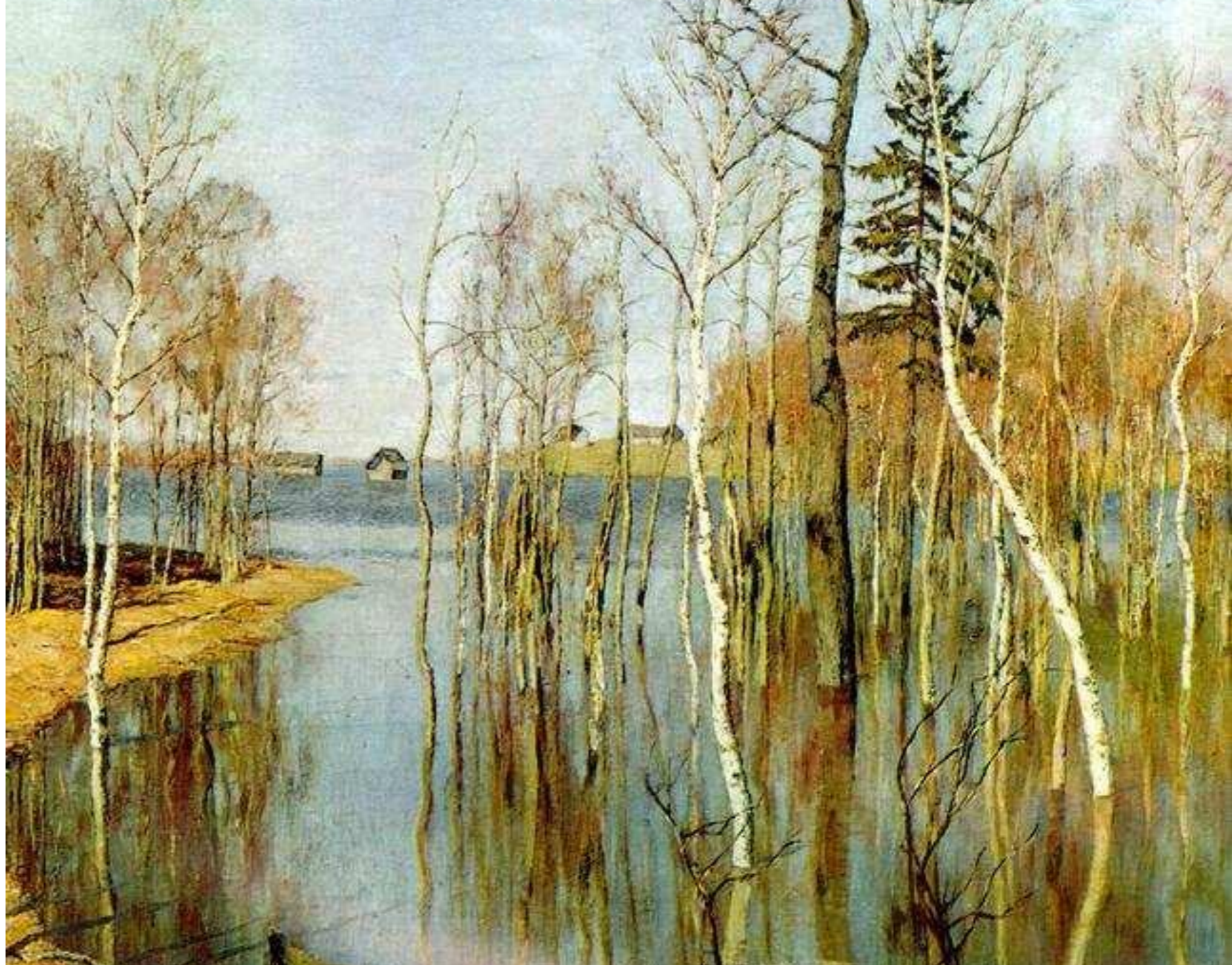
И. Левитан "Весна. Большая вода"