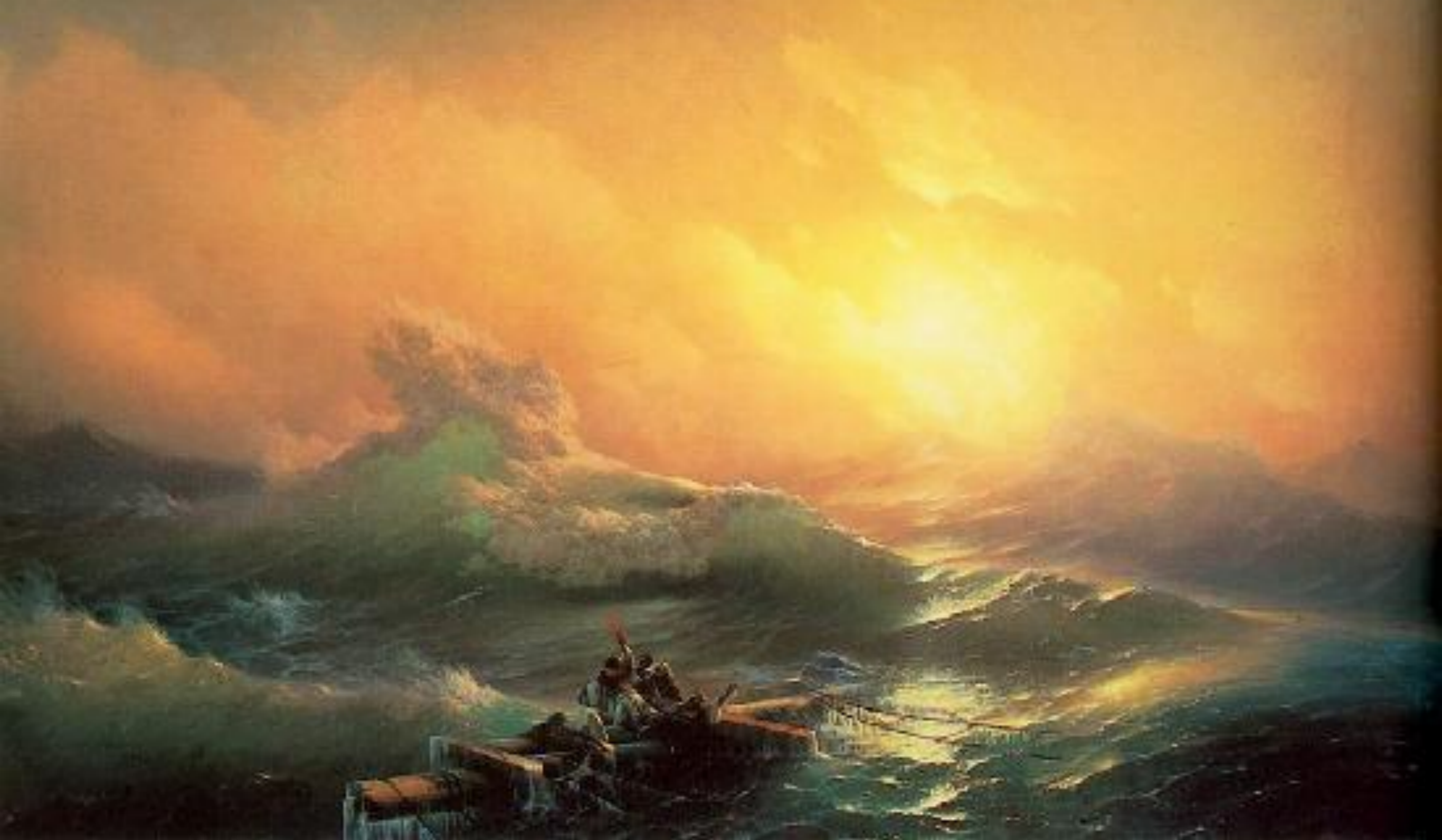
И. Айвазовский "Девятый вал"