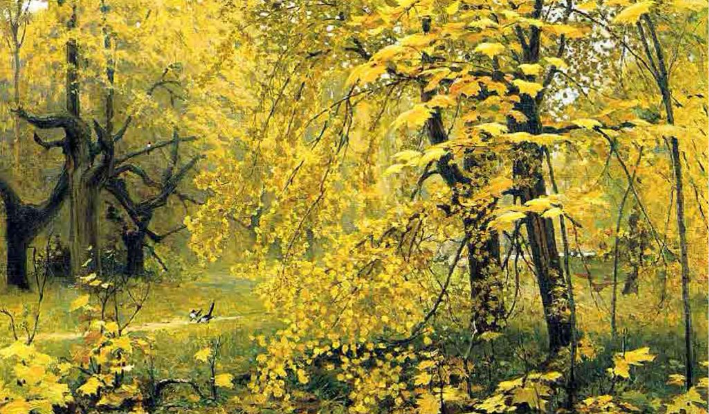
И. С. Остроухов "Золотая осень"