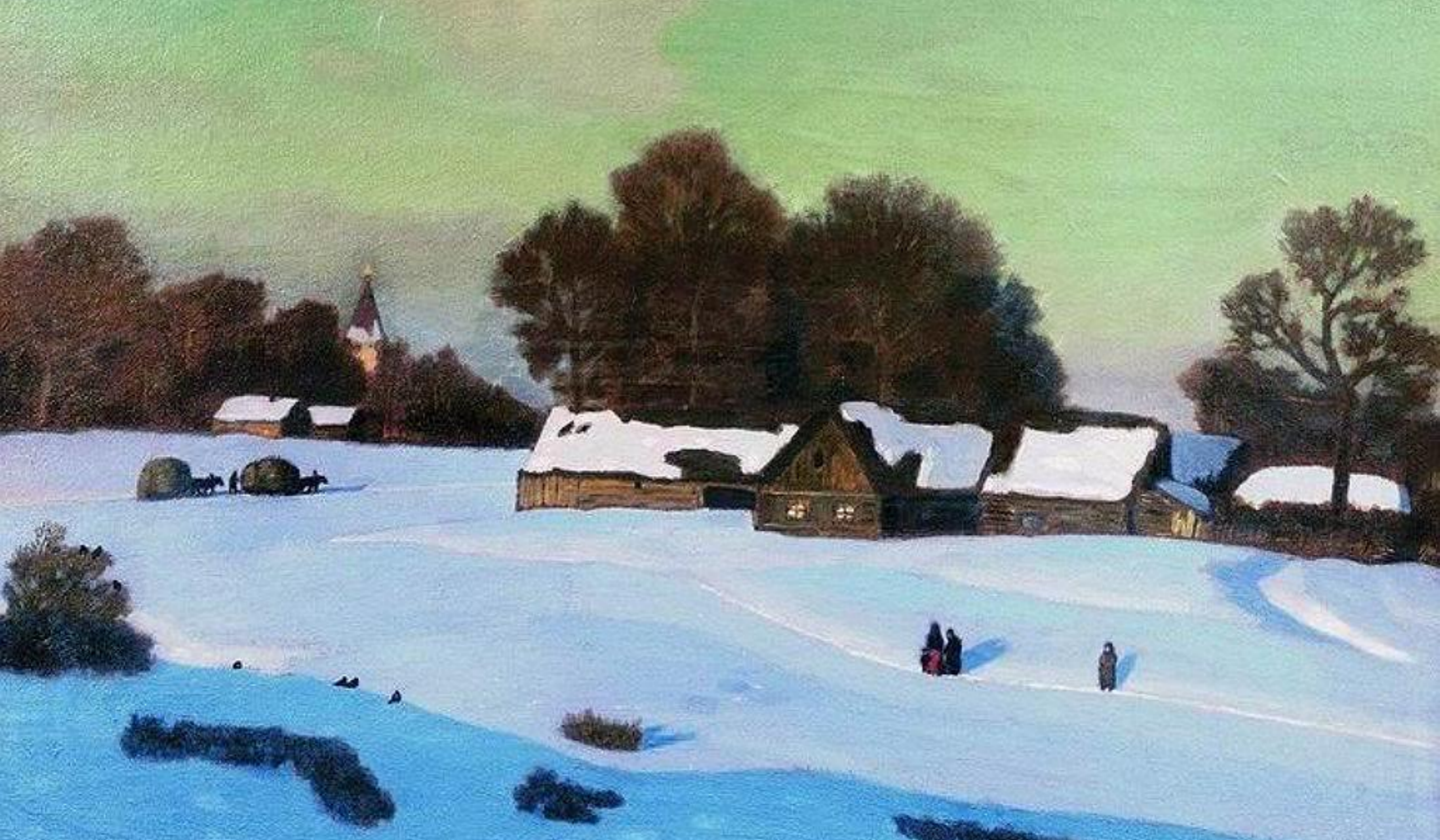
Н. П. Крымов "Зимний вечер"