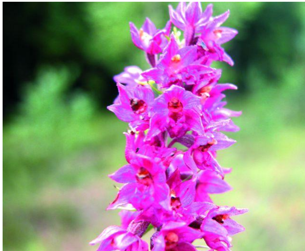
• Дремлик тёмно-красный