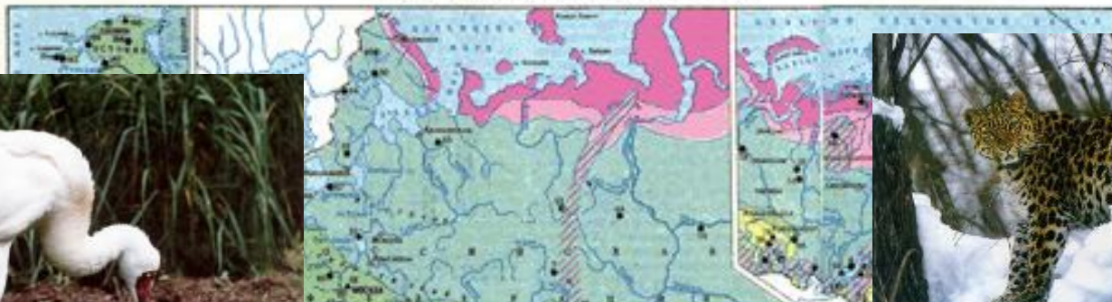
ПРИРОДНЫЕ ОСОБО ОХРАНЯЕМЫЕ ТЕРРИТОРИИ