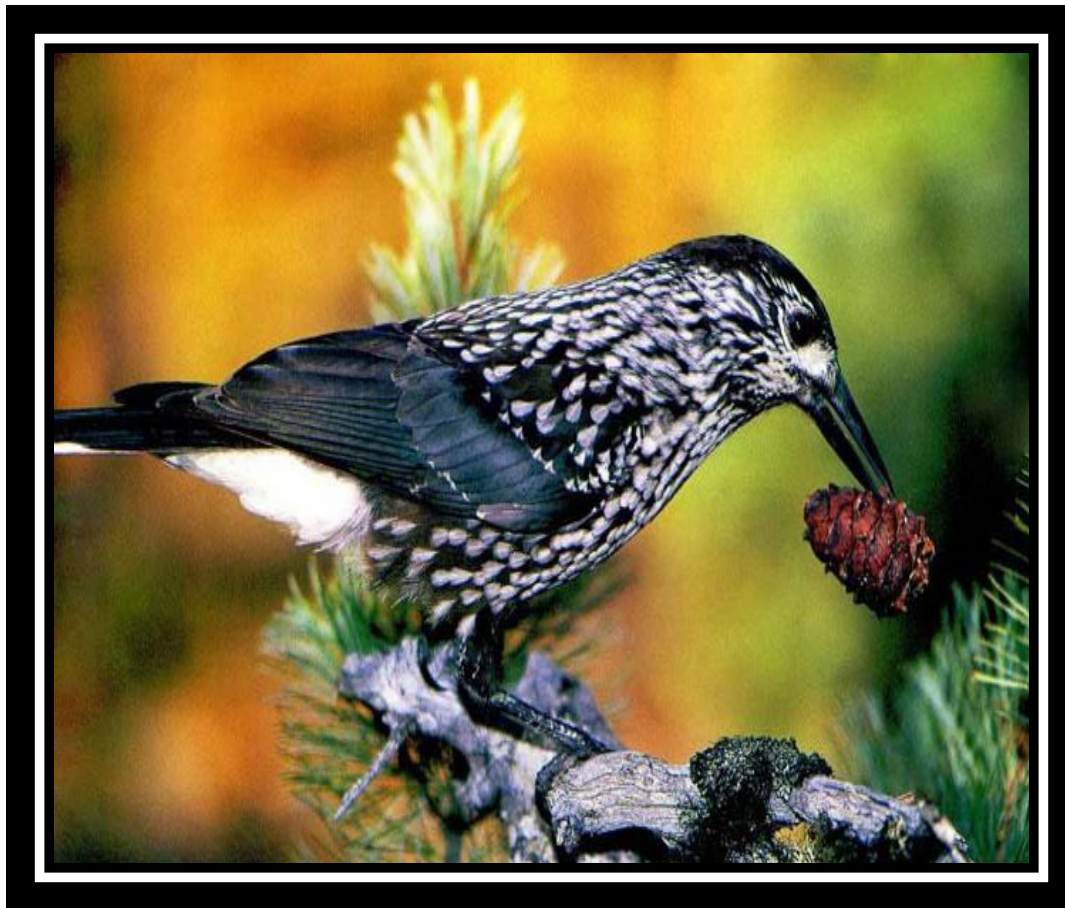
Кедровка или ореховка