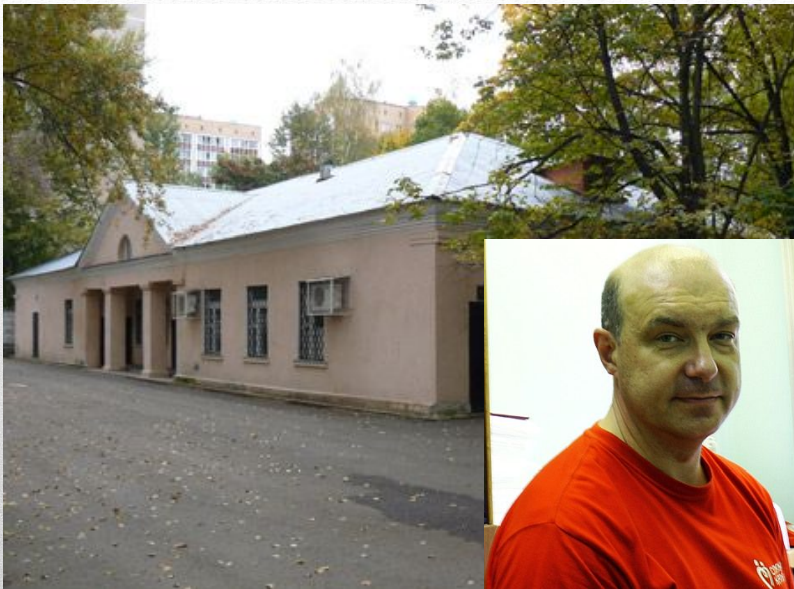
Отделение переливания крови МУЗ "Одинцовская ЦРБ"