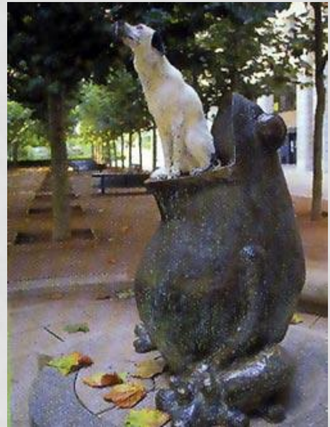
Памятник лягушке возле здания Института Пастера в Париже.