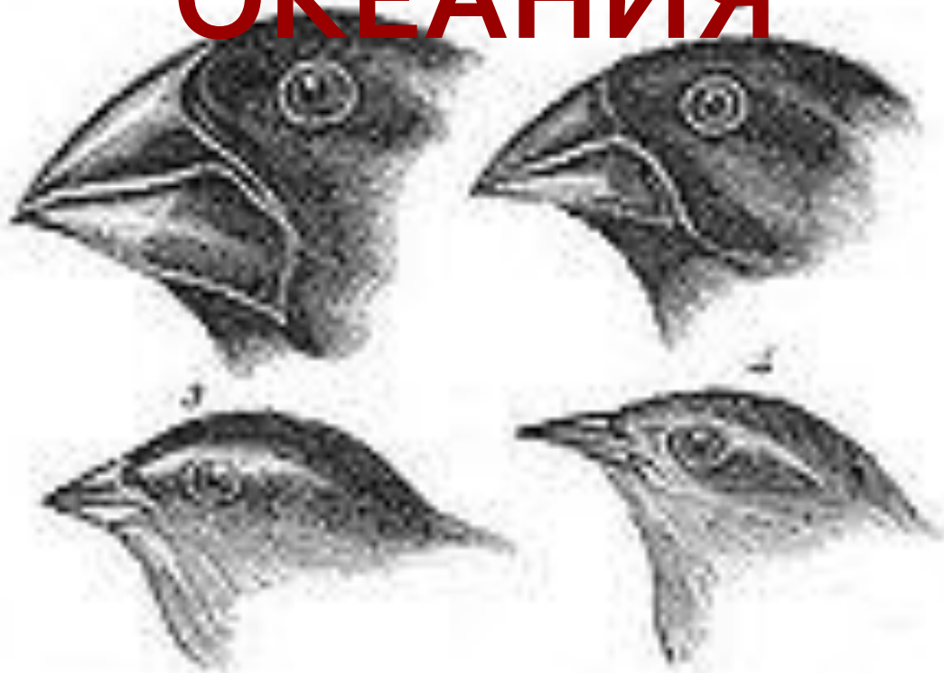
1. Geospiza magnirostris 3. Geospiza parvula