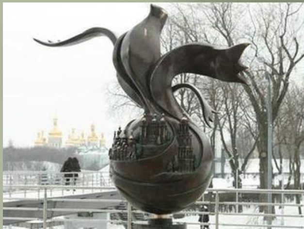
Голубю в Париже