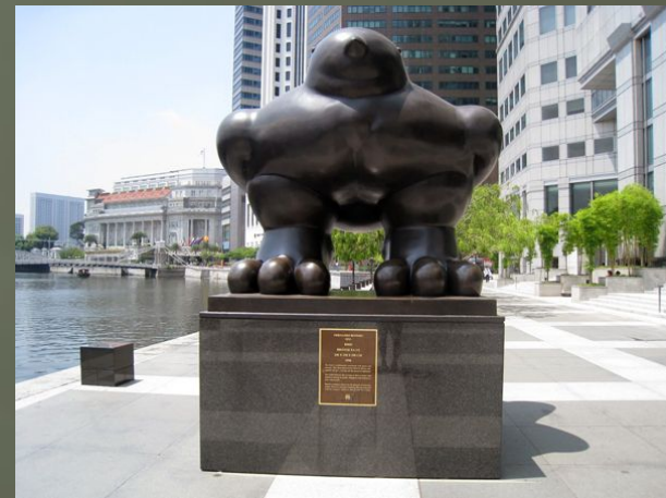
Воробью в Сингапуре.

Несмотря на то, что довольно часто люди и птицы не могут найти между собой "общего языка" и ссорятся друг с другом по разным поводам - птицы истребляют большое количество рыбы, уничтожают посевы, повреждают пастбища и т.д. - люди ценят все хорошее, что сделали для них птицы, отмечая это памятниками им в разных городах мира.