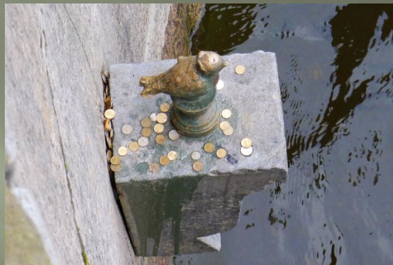
Чижику-пыжику В Санкт- Петербурге