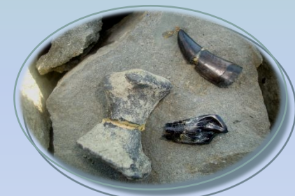
Фаланга и зубы динозавров