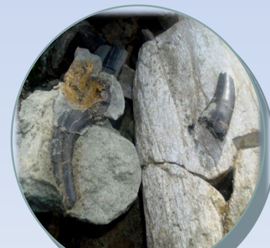
Коготь и зубы хищного динозавра