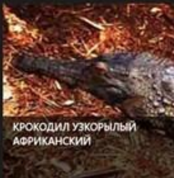
КРОКОДИЛ УЗКОРЫЛЫЙ АФРИКАНСКИЙ