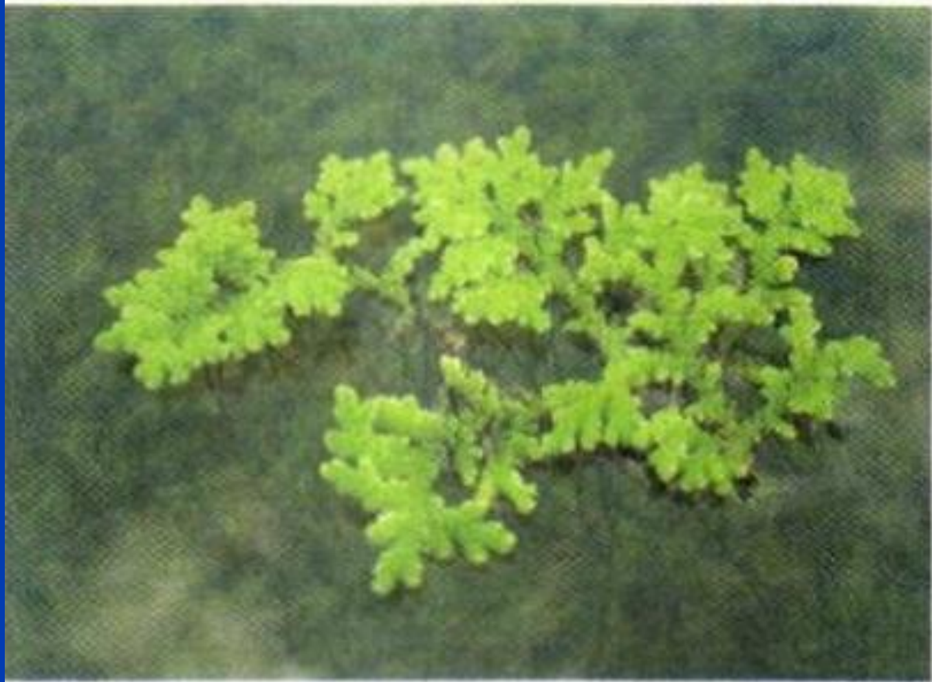
Водный папоротник азолла