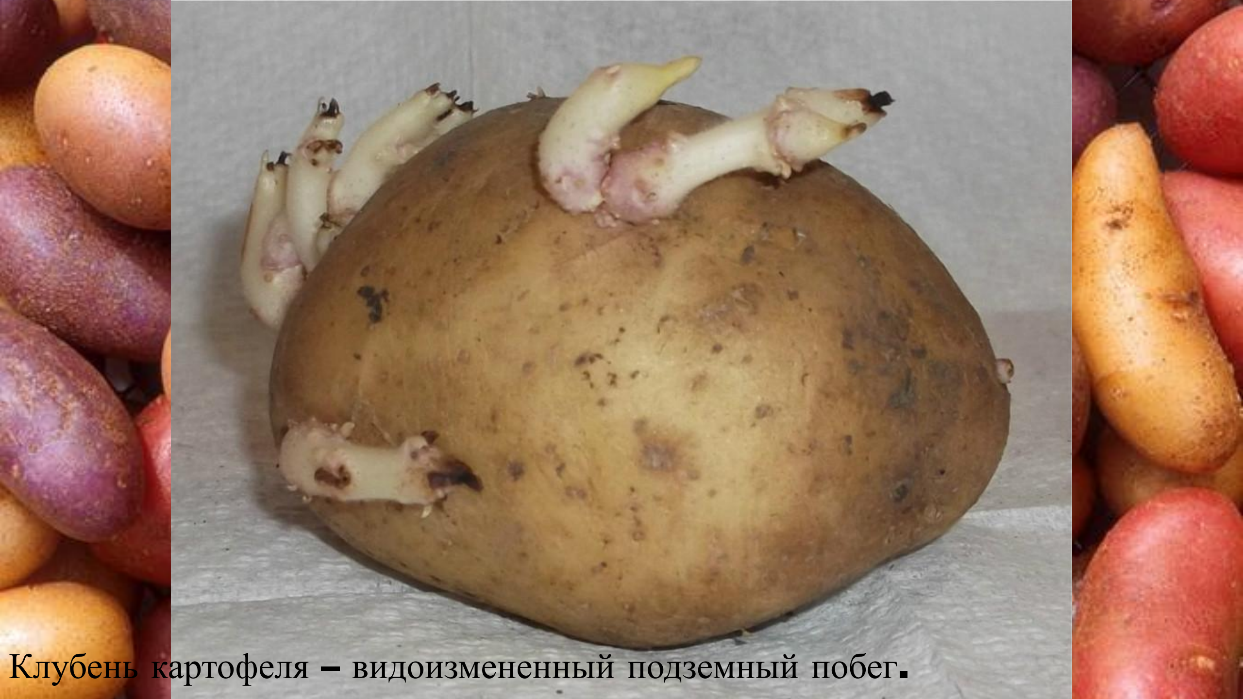
Клубень картофеля – видоизмененный подземный побег.