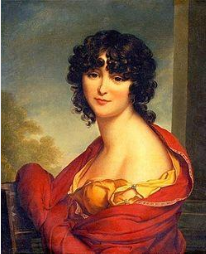
Княгиня Авдотья Голицына

Из-за довольно частых случаев отравления плодами растения крестьянское население картофель не принимало.