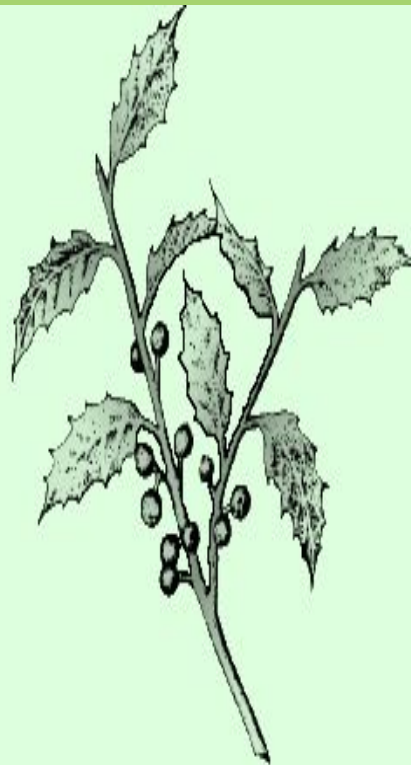
ОЧЕРЕДНЫЕ ЛИСТЬЯ (падуб американский)