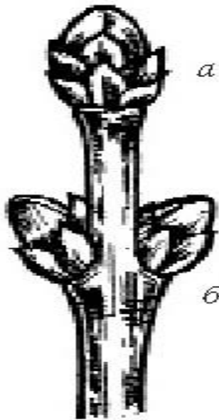
Рис. 6. а – верхушечная; б – пазушная