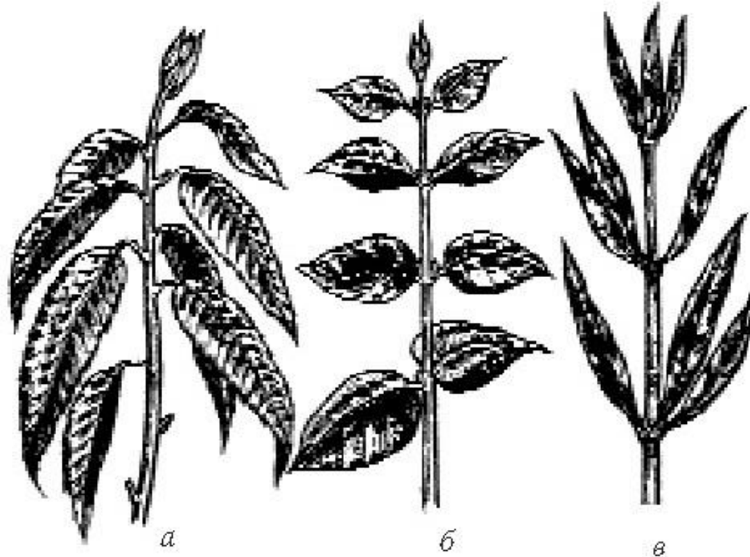
Рис. 5. Листорасположение: а – очередное; б – супротивное; в – мутовчатое