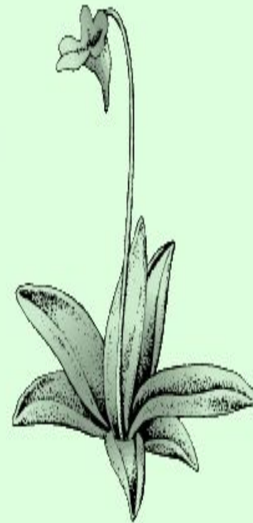
МУТОВКА ЛИСТЬЕВ (жирянка)