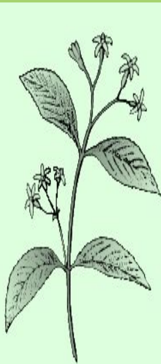
СУПРОТИВНЫЕ ЛИСТЬЯ (диервилла сидячелистная)